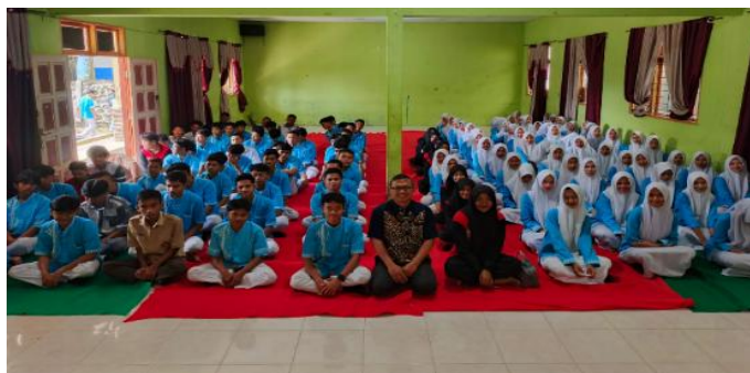
Gambar 3. Pembukaan Kegiatan

Selama pelaksanaan, rangkaian kegiatan disusun secara berjenjang untuk membentuk pemahaman yang holistik mengenai literasi digital, etika bermedia sosial, dan internalisasi nilai Pancasila dalam ruang digital.