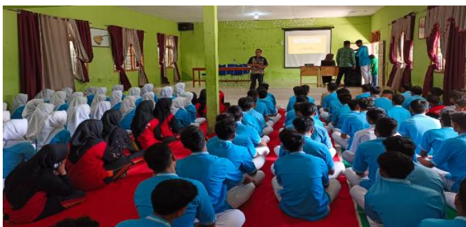
Gambar 4. Penyampaian Materi Literasi Digital dan Etika Bermedia Sosial

Setiap kelompok kemudian mempresentasikan hasil analisis di depan forum, yang tidak hanya menunjukkan hasil kerja, tetapi juga mengasah kemampuan berpikir kritis, komunikasi, dan kerja sama (sila ke-4: Kerakyatan yang dipimpin oleh hikmat kebijaksanaan). Dokumentasi kegiatan (Gambar 4) memperlihatkan suasana diskusi kelompok yang dinamis, penuh interaksi, inisiatif, dan kolaborasi antar siswa.