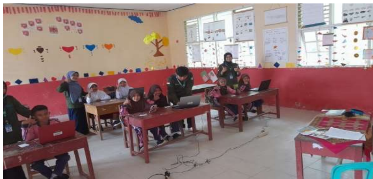
Gambar 3. Kegiatan Pelaksanaan AKM kelas dalam bentuk post-test dan pretest

Selain peran menjadi guru mahasiswa juga bisa membantu adaptasi teknologi untuk siswa dengan mengenalkan teknologi kepada siswa seperti: Hp, komputer, laptop dan infocus. mengajarkan siswa cara memanfaatkan teknologi tersebut dengan mengajak siswa belajar dengan menyimak materi dari infocus yang ditayangkan.