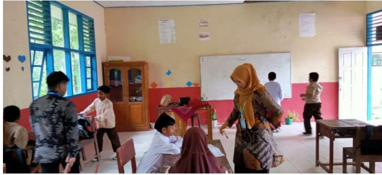
Gambar 2. Mengajar dikelas