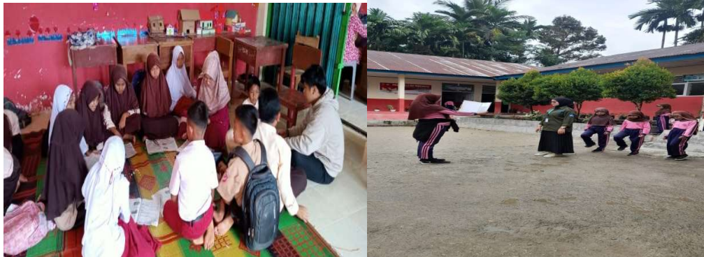
Gambar 5. Kegiatan Estrakurikuler

Pelaksanaan kegiatan ini dilakukan setelah jam pelajaran habis seperti kegiatan kelas tambahan seperti senam, class kerohanian, pekan kreativitas, dan penampilan bakat dan minat siswa.