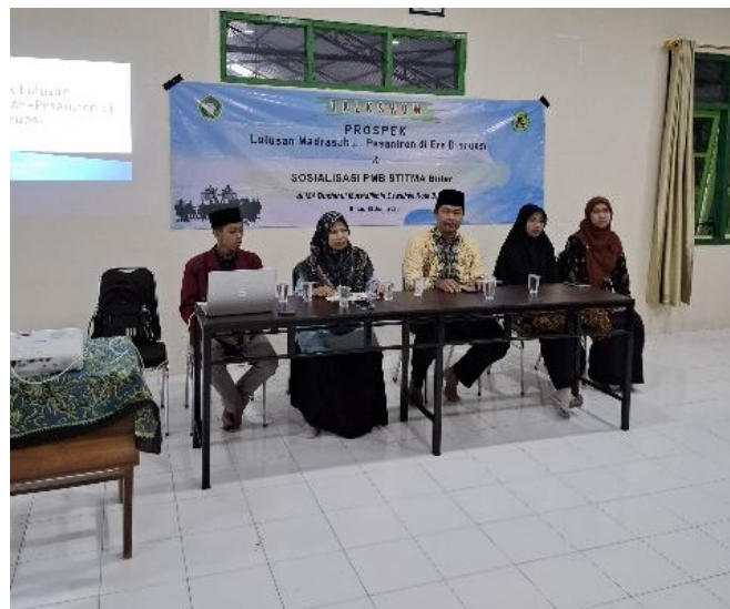
Gambar 2. Dokumentasi Sesi Seminar dan Sosialisasi

Kedua, mulai muncul minat studi yang lebih spesifik. Hal ini ditunjukkan pada saat melalui sesi sosialisasi dan bimbingan, santri mulai mengenal berbagai pilihan program studi, jenis perguruan tinggi, dan jalur masuk yang tersedia. Mereka mampu menyebutkan jurusan yang diminati serta kampus impian mereka dengan lebih terarah, didukung oleh informasi yang akurat dan inspiratif dari narasumber. Ketiga, banyak santri yang sebelumnya pesimis terhadap peluang studi lanjut karena kendala ekonomi, lalu kemudian setelah mendapatkan pendampingan, persepsi santri berubah menjadi lebih optimis setelah mengetahui berbagai program beasiswa yang bisa dimanfaatkan oleh santri, seperti Beasiswa KIP Kuliah, Beasiswa BAZNAZ, Beasiswa Pemkab dan program afirmasi dari pemerintah lainnya. Mereka mulai aktif mengajukan pertanyaan tentang persyaratan dan proses pendaftaran dari beberapa jenis beasiswa tersebut.