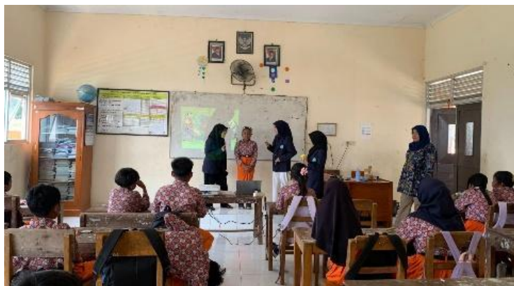
Gambar 1. Pelaksanaan Kegiatan Pkm

Tahapan pelaksanaan kegiatan berikutnya yaitu memperkenalkan digital tool dalam proses belajar, dalam hal ini tim pelaksana menggunakan English Digital Book yang telah disusun sebelumnya. Buku ini merupakan buku cerita berbahasa inggris yang disusun dengan kalimat yang mudah dimengerti oleh siswa sekolah dasar. buku tersebut juga disusun dengan menekankan pada nilai- nilai untuk mengembangkan karakter siswa sekolah dasar. Buku yang telah disusun untuk menjadi bahan materi yang digunakan dalam kegiatan ini diharapkan mampu meningkatkan antusias siswa dalam belajar bahasa inggris.