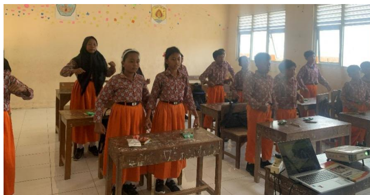
Gambar 2. Pelaksanaan Kegiatan Pkm