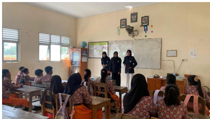
Gambar 3. Pelaksanaan Kegiatan Pkm