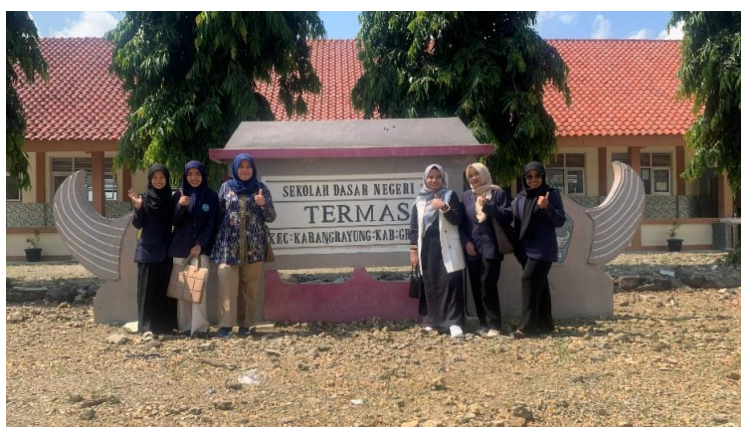
Gambar 1. Pelaksanaan Kegiatan Pkm

Kegiatan pengabdian ini dilakukan oleh tim pelaksana untuk meningkatkan kemampuan bahasa Inggris masyarakat sasaran yaitu siswa Sekolah Dasar Negeri 2 Termas. Kegiatan inti dari pengabdian pada masyarakat dilaksanakan dengan melakukan pembacaan English Story Digital Book dengan judul Two Caterpillars . Tahapan selanjutnya, tim pelaksana menekankan kembali beberapa kata yang digunakan dalam buku tersebut. Hal tersebut, diharapkan membantu siswa dalam memahami serta menggunakan kosakata dalam bahasa Inggris.