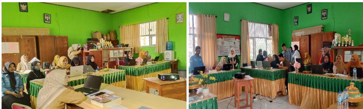
Gambar 3. Kegiatan Pelatihan

Pelatihan yang dilakukan tersebut, tim pengabdian memberikan kesempatan kepada peserta pelatihan untuk berlatih dan melakukan tugas-tugas sederhana untuk membiasakan diri dengan Microsoft office namun tetap didampingi oleh anggota tim pengabdian selama kegiatan pelatihan berlangsung.