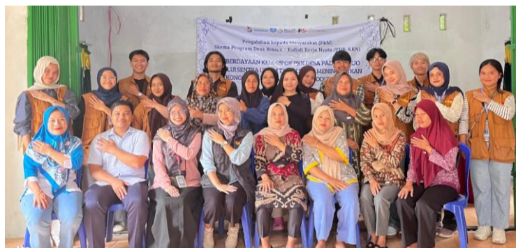
Gambar 3. Foto bersama seluruh peserta kegiatan PkM

Selain itu, kegiatan ini juga dapat meningkatkan kerja sama dan kekompakan antar anggota PKK di Desa Padang Rejo. Pada diskusi akhir sesi, muncul gagasan untuk membuat buku catatan keuangan kolektif sebagai contoh bersama, serta membentuk kelompok atau divisi yang bertugas mendampingi pencatatan dan pengelolaan keuangan bagi anggota PKK yang baru membangun UMKM. Keadaan tersebut menunjukkan bahwa kegiatan ini, tidak hanya berhasil meningkatkan pemahaman secara teori maupun teknis, tetapi juga berhasil dalam memperkuat kebersamaan dan kesadaran untuk maju bersama. Dokumentasi kegiatan pelatihan dengan seluruh peserta dan panitia PkM dapat dilihat pada Gambar 3.