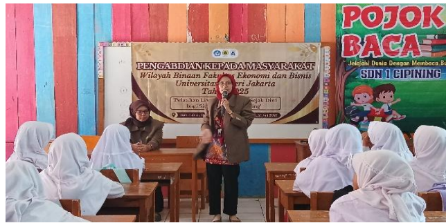
Gambar 1. Sesi Pelatihan