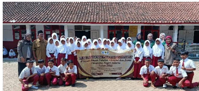
Gambar 2. Sesi Foto Bersama Peserta Pelatihan

Sebelum kegiatan dimulai, dilakukan wawancara awal dengan guru kelas untuk mengidentifikasi sejauh mana siswa memiliki pemahaman tentang konsep uang, menabung, dan membedakan kebutuhan dan keinginan. Berdasarkan hasil wawancara sebelum pelatihan, sebagian besar siswa belum memahami pentingnya merencanakan penggunaan uang saku secara sadar dan sistematis. Kebiasaan mereka lebih cenderung bersifat konsumtif, tanpa pertimbangan jangka panjang. Hal ini sejalan dengan penelitian Djuwita & Anggraini (2022), yang menemukan bahwa anak usia sekolah dasar di Indonesia cenderung belum memiliki kesadaran dalam mengelola uang karena kurangnya edukasi keuangan sejak dini.