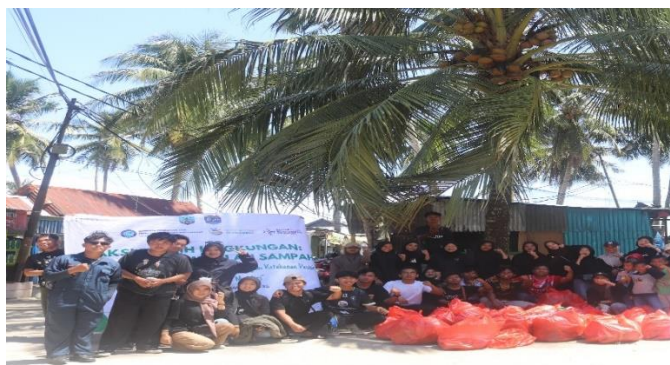
Gambar 2. Aksi bersih bersih lingkungan

Kegiatan Penanaman Mangrove (Pilar 2) untuk pencegahan abrasi adalah contoh nyata implementasi Adaptasi Berbasis Ekosistem (EbA) yang diinisiasi oleh komunitas. Keberhasilan mobilisasi Mitra (terutama Mitra 2 sebagai organizer ) dalam aksi ini menunjukkan peningkatan kapabilitas kolektif dalam menghadapi risiko iklim: