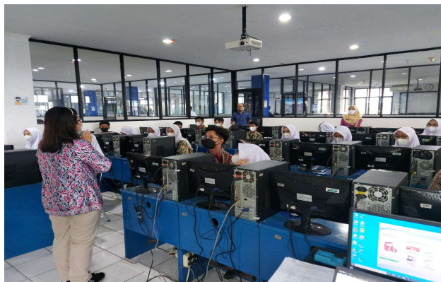
Gambar 1. Sesi Pembukaan Pelatihan

Pelatihan dilakukan pada tanggal di laboratorium komputer Universitas Budi Luhur Jakarta mulai pukul 08.00 hingga pukul 13.00 kecamatan Pesanggrahan, Jakarta Selatan. Kegiatan ini dihadiri 25 siswa XII AKL2 SMK Triguna. Kegiatan pertama berupa pembukaan yang dipimpin langsung sambutan dari ketua Tim Pengabdian Masyarakat dan perwakilan guru dari SMK Triguna 1956. Peserta diberikan penjelasan mengenai skedul kegiatan yaitu susunan acara, materi yang akan disampaikan oleh narasumber serta manfaat dari terselenggaranya pelatihan.