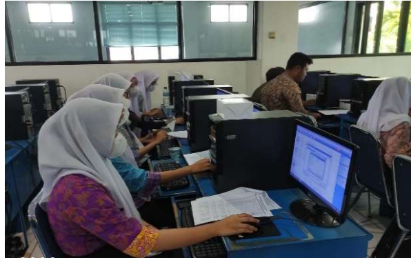
Gambar 2. Pengerjaan studi kasus dan sesi diskusi

Sesi akhir yaitu penutupan oleh perwakilan SMK Triguna 1956 dengan memberikan sambutan ucapan terimakasih dan menngharapkan dilaksanakan kembali kegiatan serupa dan diberikan kesempatan kepada salah satu peserta untuk menceritakan kesan dalam pelatihan ini. Evaluasi pelaksanaan kegiatan pengabdian masyarakat dinilai dengan pretest dan posttest untuk komparasi pengerjaan soal dan studi kasus sebelum diadakan pelatihan diperoleh persentase peserta sebesar 2% untuk dapat mengerjakan soal dengan sangat baik dan lancar hingga hasil akhir penyusunan laporan keuangan, 15% peserta mengerjakan dengan baik dan 82% tidak dapat mengerjakan dan menemukan banyak kendala untuk menyelesaikan soal studi kasus. Peningkatan terjadi setelah dilakukan pelatihan kemampuan peserta dalam mengerjakan soal sebesar 14 % peserta dapat mengerjakan dengan sangat baik, 83% dengan baik dan 7% persen belum dapat maksimal menyelesaikan hingga terbentuk laporan keuangan yang akurat. Hasil yang menggambarkan peningkatan dan kemampuan peserta sebelum dan setelah mengikuti pelatihan digambarkan dalam diagram berikut ini: