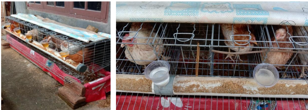
Gambar 2. Implementasi Usaha Ternak Ayam Kampung Petelor