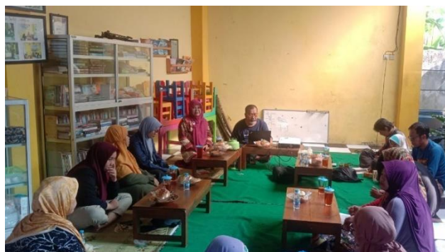
Gambar 1. Pelatihan dan Pendampingan Teknis

Pelaksanaan program pemberdayaan ekonomi melalui budidaya ayam kampung petelur memberikan berbagai dampak positif bagi perempuan kepala keluarga yatim di Karanganyar. Dampak tersebut terlihat dari peningkatan pengetahuan dan keterampilan peserta dalam mengelola usaha ternak, peningkatan pendapatan keluarga, serta terciptanya perubahan sosial dan psikologis yang lebih baik. Selain itu, proses pendampingan dalam program ini juga memberikan pembelajaran penting mengenai strategi keberlanjutan usaha rumah tangga.