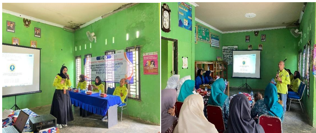
Gambar 3. Penyampaian Materi 2