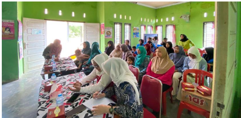
Gambar 4. Diskusi Bersama dengan Peserta