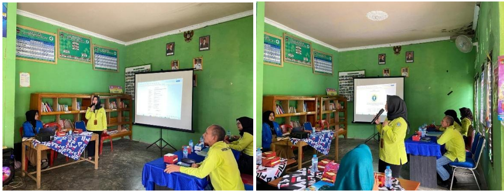
Gambar 2. Penyampaian Materi 1.