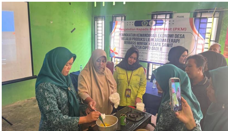
Gambar 5. Pelatihan dan Pendampingan Kepada Peserta Pembuatan Lilin Aromatherapy dari minyak kelapa sawit

Pelatihan dan pendampingan Peningkatan Kemandirian Ekonomi Desa Melalui Produksi Lilin Aromaterapi Berbasis Minyak Kelapa Sawit di Desa Ciptodadi II.