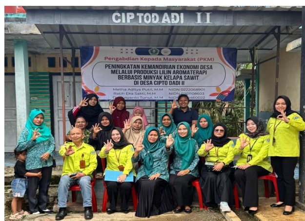
Gambar 6. Pendampingan Bersama Peserta dan Perangkat Desa