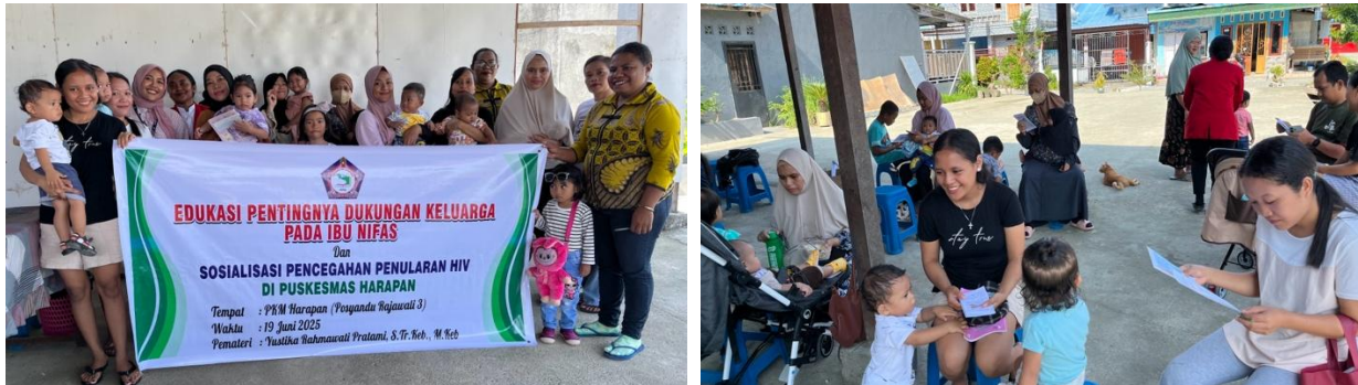
Gambar 3. Dokumentasi Kegiatan

Dari pernyataan diatas kami mengambil Kesimpulan bahwa di kelompok edukasi ini masih kurangnya dukungan pasangan ibu pada ibu selama masa nifas. Selanjutnya terkait pemberian materi pencegahan HIV, beberapa ibu mengatakan beberapa kali mendapati penyuluhan dengan materi yang sama tetapi sampai saat inipun mengaku hanya ibu saja yang rajin melakukan tes HIV selama hamil tidak dengan pasangannya.