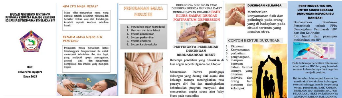
Gambar 2. Leaflet PKM

Kegiatan ini dilakukan secara bertahap selama 4 kali dalam satu bulan, kegiatan ini antarlain adalah pemberian edukasi dan konseling pentingnya dukungan keluarga pada ibu nifas dan sosialisasi pencegahan penularan HIV.