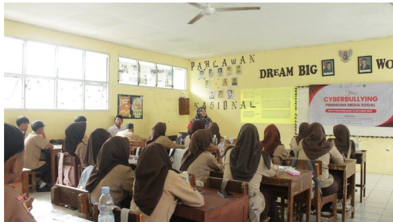
Gambar 3. Pelaksanaan Abdimas

Hasil evaluasi pembelajaran melalui pre–post test dan tanya jawab menunjukkan adanya peningkatan pemahaman kognitif siswa MAN 1 Pangandaran terkait definisi, bentuk, dan konsekuensi cyberbullying. Sebelum kegiatan, sebagian siswa cenderung memaknai cyberbullying semata-mata sebagai “menghina di media sosial”. Setelah intervensi, mereka mampu menyebutkan berbagai bentuk seperti flaming, harassment, denigration, impersonation, outing & trickery, serta exclusion, sekaligus menjelaskan dampak jangka 5644anjang bagi korban. Temuan ini konsisten dengan konsep cyberbullying literacy yang didefinisikan sebagai pemahaman dan kesadaran terhadap perilaku, risiko, dan dampak cyberbullying, serta cara meresponsnya secara tepat (Bhat et al., 2010; Fonseca & Tiago, 2024) Dengan kata lain, kegiatan pengabdian ini mengoperasionalkan gagasan bahwa literasi cyberbullying adalah bagian integral dari literasi digital dan media yang harus ditanamkan sejak remaja.