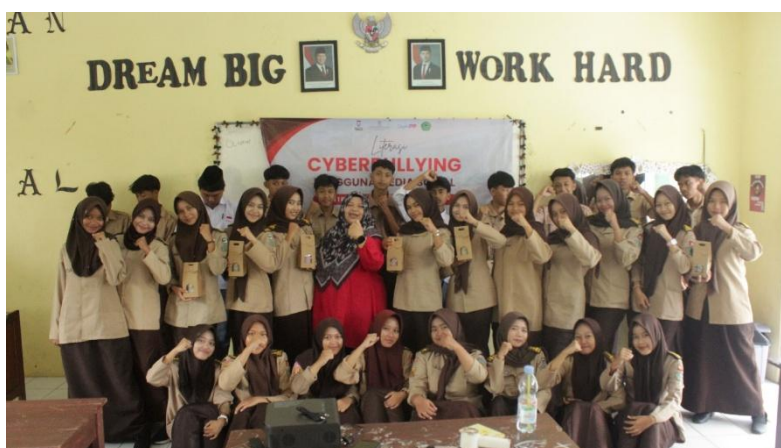
Gambar 5. Foto Bersama Mitra

Secara keseluruhan, hasil pengabdian masyarakat ini menunjukkan bahwa program literasi cyberbullying di MAN 1 Pangandaran selaras dengan dan sekaligus menguatkan temuan-temuan riset sebelumnya: penguatan literasi digital dan internet efektif sebagai strategi pencegahan (Abubakar et al., 2024; Khoerunnisa et al., 2021; Lim & Pernando, 2025), literasi cyberbullying mampu mendorong peran siswa sebagai active bystander dan membangun perilaku online yang lebih bertanggung jawab ((Fonseca & Tiago, 2024), Bhat et al., 2010; Syahputra et al., 2023), intervensi edukasi terstruktur berdampak pada peningkatan pengetahuan, sikap, dan strategi koping siswa terhadap cyberbullying (Amrullah et al., 2023; Dedeas, 2024).