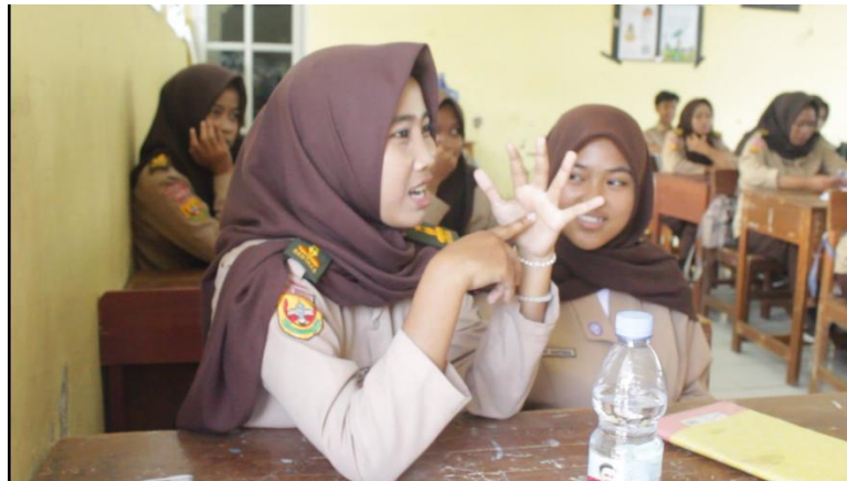
Gambar 4. Interaksi Siswa dan Pemberi Materi

Lebih jauh, kegiatan ini juga menyentuh aspek pembentukan konsep diri dan strategi koping siswa. Penjelasan mengenai dampak cyberbullying terhadap harga diri, kecemasan, dan pembentukan konsep diri dihubungkan dengan contoh nyata dan studi kasus. Respons siswa menunjukkan peningkatan kesadaran bahwa komentar negatif berulang di media sosial dapat mengikis rasa percaya diri dan memengaruhi cara mereka memandang diri sendiri. Temuan ini sejalan dengan temuan (Dedees, 2024) bahwa literasi edukasi mengenai bahaya cyberbullying berkontribusi pada pengembangan strategi koping yang lebih adaptif dan penguatan konsep diri positif di kalangan siswa SMA. Dengan kata lain, kegiatan di MAN 1 Pangandaran bukan hanya menambah pengetahuan, tetapi juga memberikan kerangka berpikir psikologis bagi siswa untuk memahami dan melindungi diri dari dampak cyberbullying.