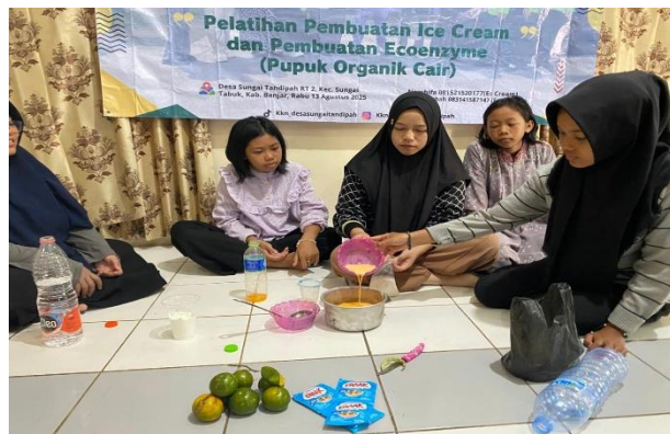
Gambar 5. Langkah 2 pembuatan es krim