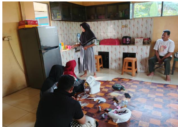
Gambar 6. Praktek pembuatan es krim di rumah warga

Untuk memastikan kemampuan aplikasi dan kemandirian peserta, sesi pelatihan dilanjutkan dengan praktik langsung di rumah warga. Pada sesi ini, seluruh tahapan pembuatan es krim diulang dengan penekanan pada penggunaan peralatan rumah tangga standar yang mudah diakses, seperti mixer rumahan biasa dan freezer milik warga. Kegiatan ini berhasil membuktikan bahwa proses produksi dapat direplikasi secara efektif di lingkungan rumah tangga, sehingga memudahkan peserta untuk memulai usaha tanpa harus bergantung pada fasilitas khusus.