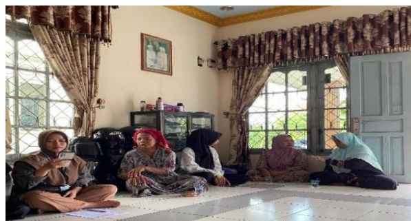
Gambar 2. Diskusi bersama

Sesi ceramah disampaikan secara sistematis, meliputi definisi es krim, fungsi spesifik setiap bahan (seperti peran maizena sebagai pengental dan Ovalet/SP sebagai penstabil emulsi ), serta tahapan proses produksi rumahan. Pemateri juga membuka diskusi interaktif, yang terbukti efektif meningkatkan antusiasme peserta. Penggunaan media PowerPoint dan proyektor efektif memvisualisasikan langkah-langkah. Antusiasme peserta terlihat dari keaktifan mereka mengajukan pertanyaan mendalam mengenai teknis pengolahan dan potensi produk sebagai usaha kecil.