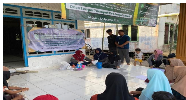
Gambar 3. Memperagakan pembuatan es krim