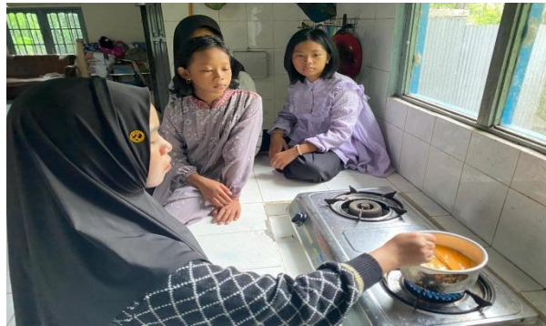
Gambar 4. Langkah 1 pembuatan es krim