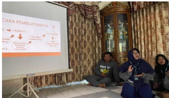
Gambar 1. Penyampaian materi

yang selama ini hanya dijual dalam bentuk buah segar. Kegiatan ini dilaksanakan selama lima hari, yaitu pada 13–17 Agustus 2025, dengan fokus utama kegiatan berpusat di Posko KKN. Program ini melibatkan total 30 peserta, yang sebagian besar terdiri dari pelajar dan ibu rumah tangga desa. Metode yang diterapkan dalam pelatihan adalah kombinasi antara penyampaian materi ceramah dengan dukungan media visual dan praktik langsung pembuatan produk.