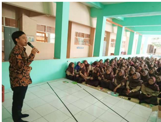
Gambar 3. Sosialisasi manajemen stress dan orientasi problem solving

Dalam pelatihan hardiness yang dilakukan oleh pengabdian, terdapat juga pelatihan berpikir kreatif, dimana berpikir kreatif membuat individu melihat masalah dalam hidupnya menjadi dapat melihat tantangan sebagai peluang untuk belajar dan tumbuh. Sesuai dengan penelitian yang dilakukan Hikmah (2021), bahwa berpikir kreatif yang dilatih untuk siswa SMK membuat siswa belajar untuk mampu berpikir kritis, dapat memecahkan masalah, mampu berkomunikasi, dan kerjasama. Kemampuan berpikir kreatif membuat siswa agar dapat memanfaatkan kreativitas mereka secara optimal dalam bekerja. Berikut salah satu foto kegiatan dalam proses pengabdian.