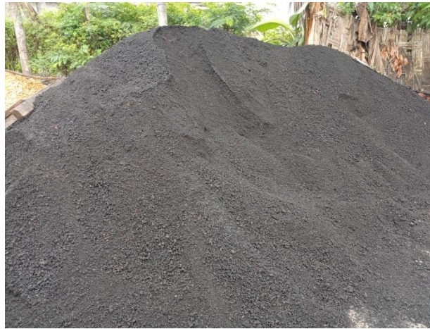
Gambar 5. Agregat Halus (Pasir)

Agregat halus adalah mineral alami yang berfungsi sebagai bahan pengisi dalam campuran beton yang memiliki ukuran butiran kurang dari 5 mm atau lolos saringan no.4 dan tertahan pada saringan no.200. Agregat halus berasal dari hasil disintegrasi alami dari batuan alam atau pasir buatan yang dihasilkan dari alat pemecah batu ( stone crusher ). Pasir umumnya terdapat disungai-sungai yang besar. Akan tetapi sebaiknya pasir yang digunakan untuk bahan-bahan bangunan dipilih yang memenuhi syarat.