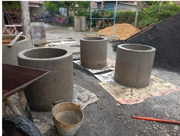
Gambar 4. Buis Beton Sumur Gali / Gorong-Gorong

Agregat halus adalah mineral alami yang berfungsi sebagai bahan pengisi dalam campuran beton yang memiliki ukuran butiran kurang dari 5 mm atau lolos saringan no.4 dan tertahan pada saringan no.200. Agregat halus berasal dari hasil disintegrasi alami dari batuan alam atau pasir buatan yang dihasilkan dari alat pemecah batu ( stone crusher ). Pasir umumnya terdapat disungai-sungai yang besar. Akan tetapi sebaiknya pasir yang digunakan untuk bahan-bahan bangunan dipilih yang memenuhi syarat.