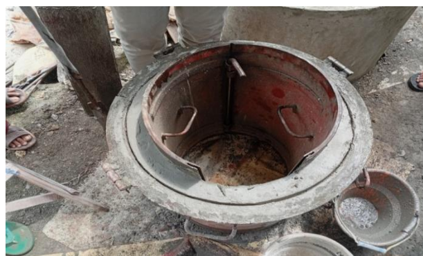
Gambar 9. Buis Beton Hasil Pengabdian