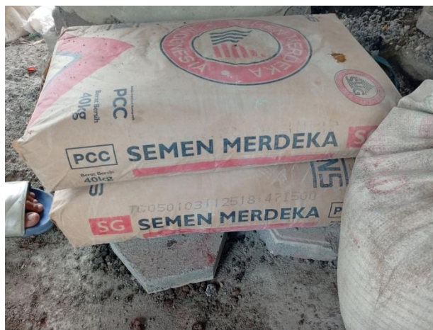
Gambar 7. Semen Portland

Semen portland adalah jenis semen yang paling umum yang digunakan secara umum di seluruh dunia sebagai bahan dasar beton , mortar , plester , dan adukan non-spesialisasi. Semen ini adalah serbuk halus yang diproduksi dengan memanaskan batu gamping dan mineral tanah liat dalam tanur untuk membentuk klinker, penggilingan klinker, dan menambahkan sejumlah kecil bahan lainnya.