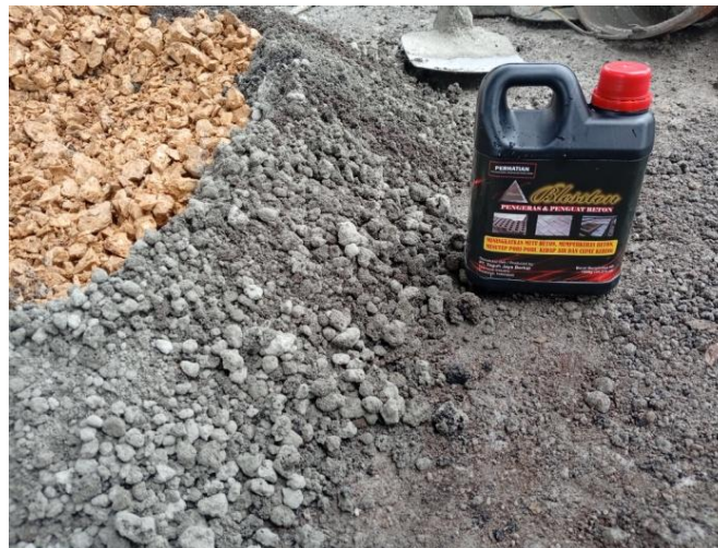
Gambar 3. Cairan Blesston

Cairan Blesston adalah cairan pengeras beton yang berfungsi meminimalisir pori-pori pada beton, mencegah keretakan pada beton, meningkatkan mutu beton dan mempercepat pengeringan beton/cor.