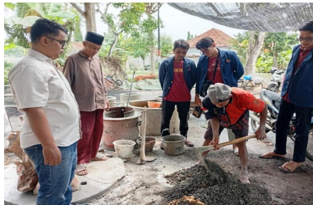
Gambar 8. Proses Pembuatan Buis Beton