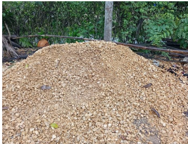
Gambar 6. Agregat Kasar (Kerikil)

Semen portland adalah jenis semen yang paling umum yang digunakan secara umum di seluruh dunia sebagai bahan dasar beton , mortar , plester , dan adukan non-spesialisasi. Semen ini adalah serbuk halus yang diproduksi dengan memanaskan batu gamping dan mineral tanah liat dalam tanur untuk membentuk klinker, penggilingan klinker, dan menambahkan sejumlah kecil bahan lainnya.