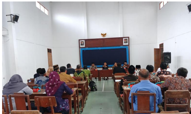
Gambar 5. Sesi diskusi.

Metode analisis SWOT digunakan sebagai alat bantu untuk menggali potensi dan hambatan yang dimiliki Koperasi Desa Merah Putih Kalurahan Ngentakrejo. Dengan mempertimbangkan dan mengidentifikasi komponen SWOT yaitu kekuatan, kelemahan, peluang, dan ancaman ibu-ibu Dasawisma Tratai diajak dalam membangun kinerja kepemimpinan dan membangun mindset kewirausahaan di Koperasi Desa Merah Putih Kalurahan Ngentakrejo. Sebagai penutup kegiatan, pada Gambar 5 dilaksanakan sesi diskusi dan tanya jawab secara terbuka. Di sesi ini diharapkan memberikan ruang bagi anggota Koperasi Desa Merah Putih Kalurahan Ngentakrejo untuk menyampaikan pengalaman, pendapat, bahkan mengajukan pertanyaan sesuai meteri yang telah disampaikan.