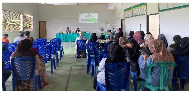
Gambar 4. Seminar Pelatihan Manajemen dan Literasi Keuangan Syariah

Pelatihan literasi keuangan ini berdampak langsung pada peningkatan keterampilan UMKM, terutama dalam hal mengelola keuangan usaha. Banyak pelaku usaha sebelumnya tidak memiliki catatan keuangan sehingga keuntungan sering tercampur dengan kebutuhan rumah tangga. Setelah pelatihan, UMKM mulai menerapkan pencatatan sederhana menggunakan buku dan template laporan yang diberikan.