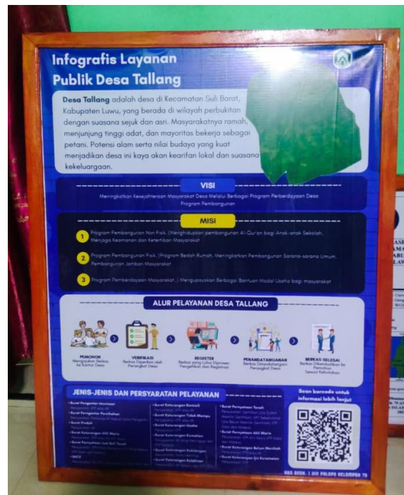
Gambar 2. Infografis Pelayanan Publik Desa Tallang

Infografis dirancang untuk mempermudah masyarakat memahami berbagai layanan yang tersedia di kantor desa. infografis mencakup alur pelayanan administrasi, syarat pengurusan dokumen, dan informasi penting lainnya. Dengan penyajian yang sederhana, menarik, dan mudah dipahami, infografis ini mendukung transparansi pelayanan sekaligus mengurangi kebingungan masyarakat dalam mengurus kebutuhan administratif.