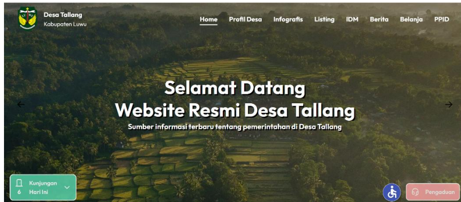
Gambar 1. Tampilan Website Desa Tallang

itu, website juga difungsikan sebagai media promosi produk UMKM dan potensi wisata yang ada di desa.