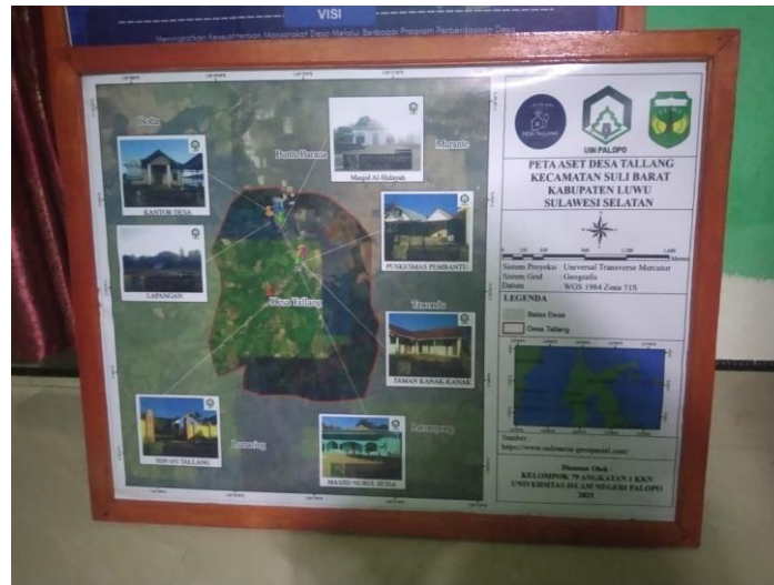
Gambar 3. Visual Peta Aset Desa Tallang

adanya visualisasi aset, pemerintah desa memiliki gambaran yang jelas dalam merencanakan pembangunan serta mempromosikan potensi desa kepada pihak luar.