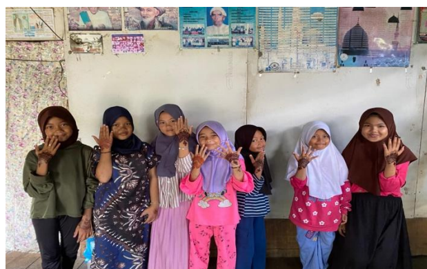
Gambar 3. Karya Henna yang Dihasilkan Peserta

Dokumentasi pada Gambar 2 dan Gambar 3 menunjukkan proses dan hasil yang dicapai selama pelaksanaan pelatihan keterampilan seni henna. Terlihat bahwa peserta mengikuti kegiatan dengan penuh antusiasme dan mampu menghasilkan karya-karya henna yang memiliki nilai estetika tinggi. Perkembangan keterampilan peserta dari tahap awal hingga akhir pelatihan menunjukkan efektivitas metode pembelajaran berbasis praktik langsung. Hasil karya yang dihasilkan tidak hanya memperlihatkan peningkatan kemampuan teknis dalam membuat motif henna, tetapi juga mencerminkan kreativitas peserta dalam mengembangkan desain yang unik. Beberapa peserta bahkan berhasil mengintegrasikan unsur kearifan lokal seperti motif daun ilung dan gelombang Sungai Martapura ke dalam karya mereka, yang menunjukkan pemahaman akan pentingnya melestarikan identitas budaya daerah melalui seni. Keberhasilan ini menjadi bukti konkret bahwa pelatihan seni henna dapat menjadi media efektif untuk mengembangkan keterampilan sekaligus membuka wawasan tentang peluang ekonomi kreatif bagi generasi muda di pedesaan.