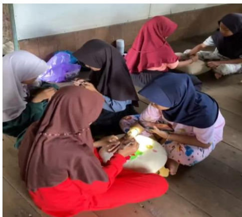
Gambar 2. Peserta pada Sesi Praktik Pelatihan Henna

peserta juga diminta menampilkan hasil karya terbaiknya yang dinilai berdasarkan aspek kerapian, komposisi, dan orisinalitas desain. Ilustrasi pelaksanaan kegiatan disajikan pada gambar di bawah ini: