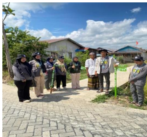
Gambar 2. Pelaksanaan Pemasangan Batas RT