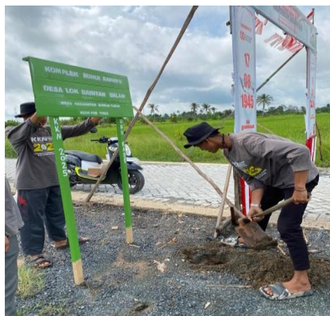
Gambar 1. Pelaksanaan pemasangan Plang Jalan

Secara keseluruhan, program pembuatan plang nama jalan dan batas RT berhasil dilaksanakan sesuai dengan rencana dan memberikan dampak yang signifikan bagi masyarakat. Hasil kegiatan ini tidak hanya berupa sarana informasi wilayah, tetapi juga peningkatan kesadaran masyarakat akan pentingnya keteraturan lingkungan. Ketua RT dan perangkat desa menyampaikan apresiasi atas hasil program karena mempermudah pendataan warga, pengiriman surat, serta penunjuk arah bagi tamu desa. Gambar ilustrasi pelaksanaan pemasangan plang nama jalan dan batas RT pada dilihat pada Gambar berikut.