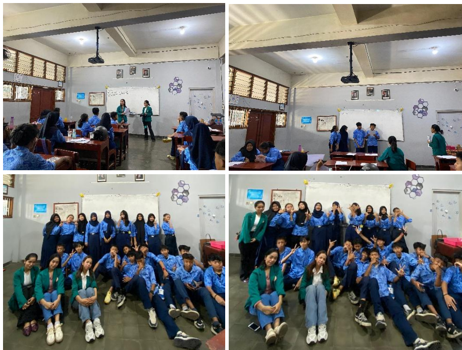
Gambar 2. Dokumentasi kegiatan