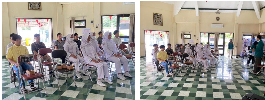
Gambar 2. Kegiatan Pelatihan

Sesi relaksasi napas perlahan sebagai inti pelatihan juga memberikan dampak signifikan. Perawat melaporkan rasa lebih tenang, fokus, dan berkurangnya kelelahan emosional. Temuan ini konsisten dengan penelitian (Nur et al., 2024) yang menunjukkan bahwa relaksasi autogenik mampu menurunkan burnout pada perawat. Secara keseluruhan, hasil pelatihan sesuai dengan rencana kegiatan: ice breaker untuk kesiapan emosional, penyampaian materi singkat, serta relaksasi sebagai intervensi utama. Penurunan skor burnout pada posttest menjadi indikator bahwa pelatihan efektif dan layak diterapkan kembali.