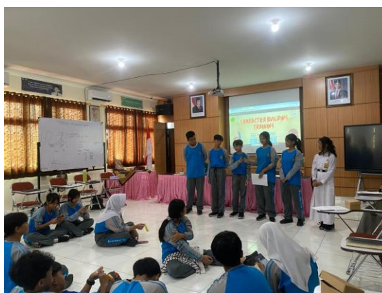
Gambar 4. Role Play Simulasi Krisis

Hasil pelaksanaan kegiatan menunjukkan Sebanyak 35 siswa Pengurus SMP Negeri 4 Yogyakarta mengikuti Character Building Training. Berdasarkan hasil uji paired sample T test, sebelum siswa mengikuti pelatihan rata-ratanya sebesar 12,5 atau 12,5%. Sedangkan setelah dilakukan, rata-ratanya sebesar 19,8 atau 19,8%. Dapat disimpulkan bahwa terdapat peningkatan yang signifikan sebelum dan sesudah adanya pelatihan Character Building, yang di buktikan dari 0,001 < 0,05 . Artinya,