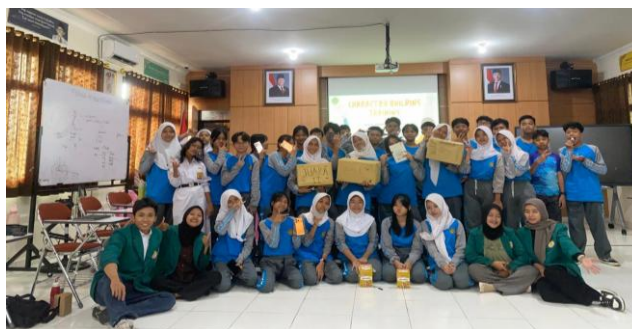
Gambar 1 Peserta Kegiatan Pelatihan

Kegiatan pelatihan character building ini dilaksanakan di SMP N 4 Yogyakarta. Peserta yang mengikuti pelatihan ini adalah seluruh anggota OSIS SMP N 4 Yogyakarta yang berjumlah 35 siswa.