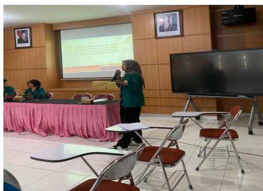
Gambar 3. Proses Psikoedukasi