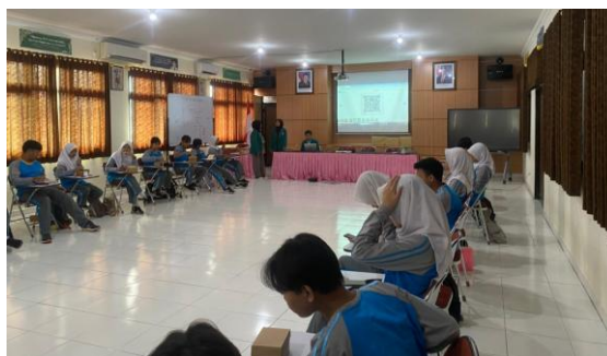
Gambar 2. Pengerjaan Pretest dan Postest

Sebelum penyampaian materi, pelaksana kegiatan melaksanakan pre-test melalui tautan Google Form. Setelah materi disampaikan, dilanjutkan dengan post-test untuk mengukur perbedaan tingkat pemahaman peserta mengenai character building.