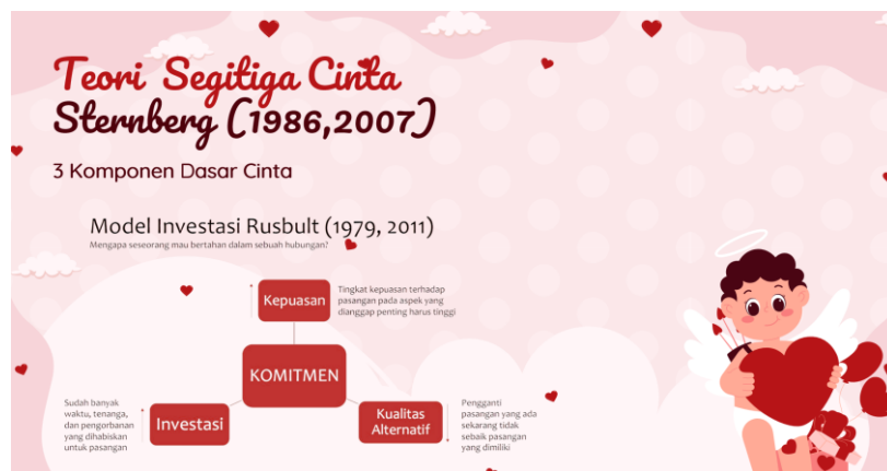
Gambar 3. Model Investasi Rusbult

Sebagai pengayaan, tim juga memperkenalkan Investment Model of Commitment dari Rusbult untuk menjelaskan mengapa seseorang memilih bertahan dalam sebuah relasi. Model ini menyatakan bahwa komitmen ditentukan oleh tiga faktor utama: (1) kepuasan terhadap relasi, (2) kualitas alternatif di luar relasi, dan (3) besarnya investasi yang telah ditanamkan (waktu, tenaga, pengorbanan, serta sumber daya bersama). Ketika kepuasan dan investasi tinggi serta alternatif dinilai rendah, komitmen cenderung menguat (Rusbult, 1980).