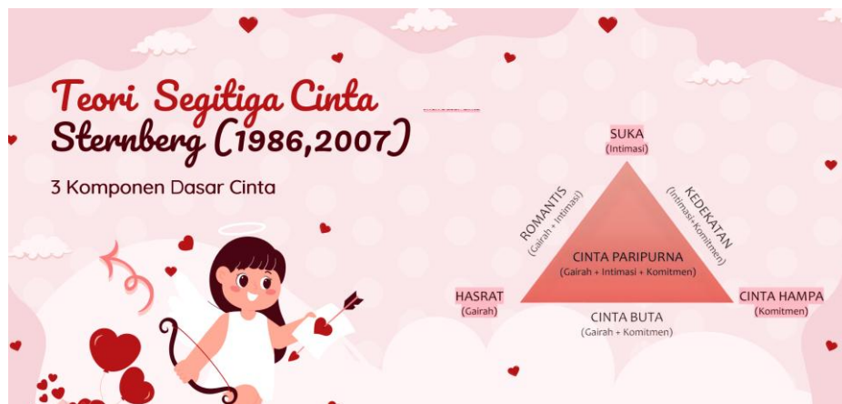
Gambar 2. Komponen dasar Cinta

Selain simulasi, tim juga memberikan materi reflektif berbasis Triangular Theory of Love (Sternberg) sebagai kerangka sederhana untuk membantu peserta memetakan kualitas relasi dalam keluarga, khususnya relasi pasangan, melalui tiga komponen utama: intimasi (kedekatan emosional), gairah/hasrat, dan komitmen. Materi ini menegaskan bahwa harmoni keluarga tidak cukup ditopang oleh komitmen untuk “bertahan”, tetapi juga memerlukan pemeliharaan intimasi melalui komunikasi empatik, kehadiran penuh (quality time), dan keterbukaan. Dalam diskusi kasus, peserta diajak mengidentifikasi komponen relasi yang paling melemah akibat penggunaan gawai atau konflik di media sosial, lalu menyusun strategi praktis – misalnya waktu bebas gawai, check-in emosi harian, dan kesepakatan respons saat terjadi perbedaan – untuk memperkuat intimasi dan komitmen secara berkelanjutan (Saktiana, 2022).