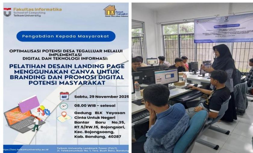
Gambar 2. Poster kegiatan dan Dokumentasi Pelaksanaan Pelatihan

Pada tahapan pelatihan teori dan praktek, Tim mengadakan pelatihan desain landing page dengan Canva di Yayasan Rumah Katumbiri, Desa Tegalluar. Hasil kegiatan ini dianalisis berdasarkan data kuesioner evaluasi peserta, observasi selama pelatihan, pre test dan post test serta dokumentasi kegiatan sebagaimana dipublikasikan secara resmi oleh Telkom University. Gambar 2 menampilkan poster kegiatan dan suasana saat pelaksanaan kegiatan, sedangkan gambar 3 menampilkan cuplikan modul pelatihan yang telah disusun oleh tim.