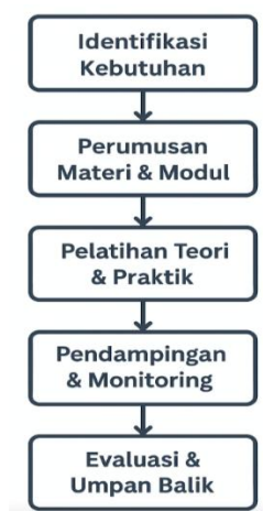
Gambar 1. Metode Pelaksanaan Abdimas

Pelaksanaan kegiatan pengabdian masyarakat di Yayasan Rumah Katumbiri menggunakan pendekatan metodologis yang terstruktur dan berorientasi pada kebutuhan peserta. Metode ini dirancang untuk memastikan bahwa pelatihan yang diberikan efektif, relevan, dan berkelanjutan, serta mampu memberdayakan peserta dalam mengembangkan keterampilan digital secara mandiri. Secara keseluruhan, metode terdiri dari empat tahapan utama: pendekatan partisipatif, pelatihan teoritis-praktis, pendampingan dan monitoring, serta evaluasi dan umpan balik.