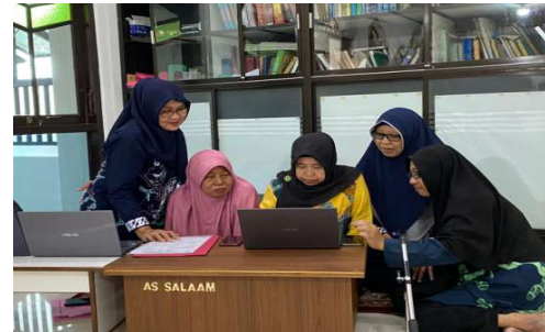
Gambar 2. Kegiatan Pengabdian

Merujuk pada hasil pre-test maka Tim PkM akan memberikan literasi pengelolaan keuangan bagi takmir masjid. Literasi pengelolaan keuangan diberikan agar laporan keuangan masjid akuntabel dan transparan (Siregar, D., K. et al. 2023), dijelaskan juga tentang akun-akun yang dipergunakan dalam pembukuan dan manfaat membuat pembukuan keuangan yang tertib dan teratur, dokumentasi kegiatan disajikan pada gambar 2. Hasil kegiatan pemberian literasi pengelolaan keuangan ini para takmir masjid mampu memahami kondisi internal dan eksternal masjid yang dikelolanya.