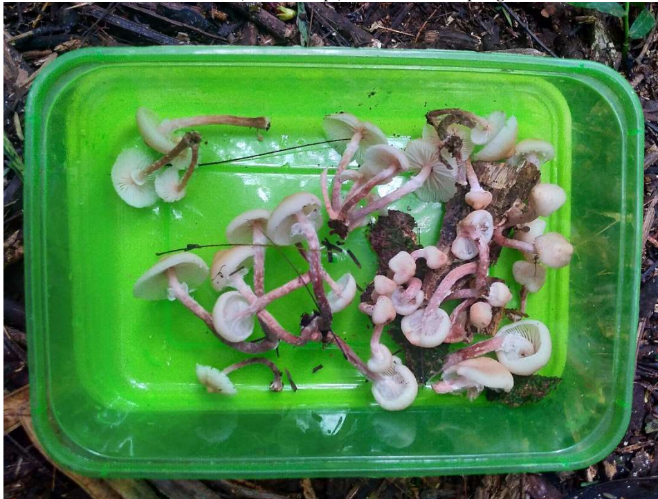
Gambar 8. Armillaria nova-zelandiae (supa jambu) edible yang tumbuh di lokasi pengabdian