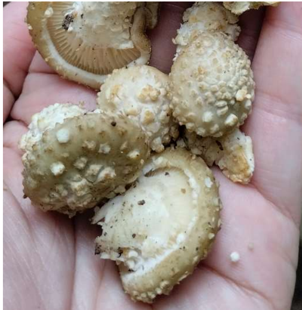
Gambar 7. Koleksi Shiitake ( Lentinula sp.) di hutan lokasi pengabdian