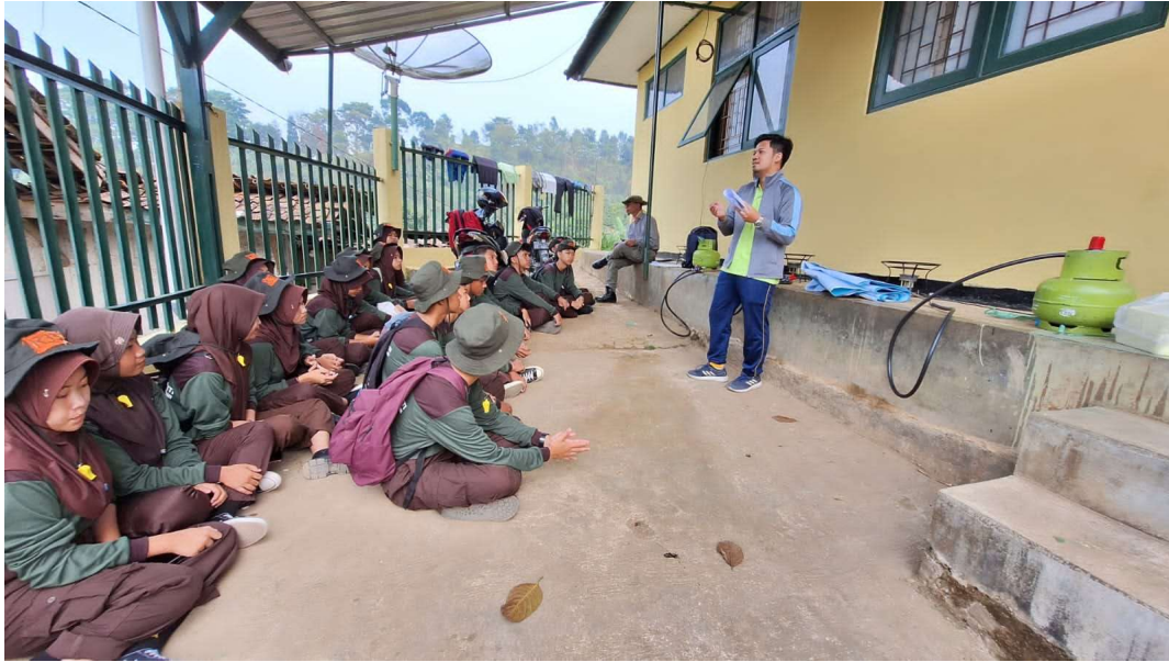
Gambar 5. Pemberian materi sebelum ke lapangan dan pre test