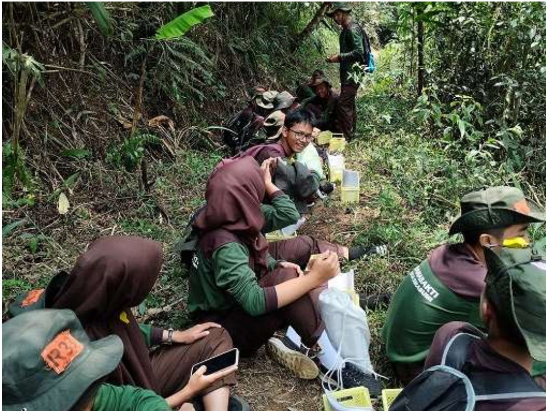
Gambar 6. Kegiatan belajar identifikasi dan koleksi jamur di alam