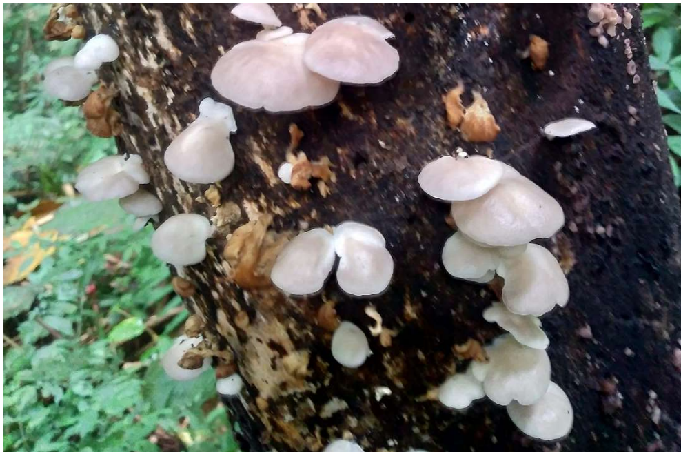
Gambar 10. Jamur phoenix ( Pleurotus pulmonarius ) edible liar di lokasi pengabdian