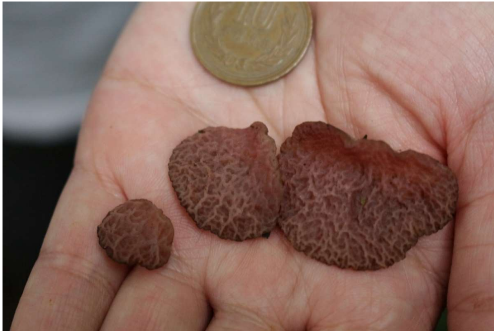
Gambar 9. Auricularia delicata edible liar di lokasi pengabdian