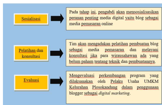
Gambar 2. Tahapan Pelaksanaan Pengabdian Masyarakat

Tahap pelaksanaan yang dilakukan oleh pengabdian adalah melakukan sosialisasi, tahap ini bertujuan untuk memberikan dan mengenalkan Blog sebagai media pemasaran online pada Pelaku Usaha UMKM Kelurahan Plosokandang Tulungagung, waktu yang diperlukan hanya 1 hari. Pada tahap ini, pihak pelaku usaha akan mendapatkan penjelasan pentingnya Blogger dalam media pemasaran. Dalam upaya penguatan strategi pemasaran secara inovatif sebagai optimalisasi eksistensi