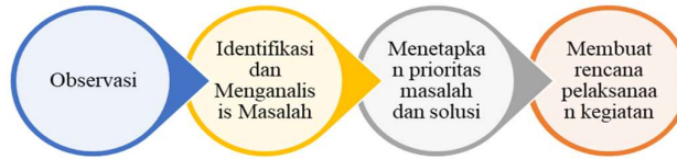
Gambar 1. Tahapan Persiapan Pengabdian Masyarakat

Plosokandang Kabupaten Tulungagung” ini dilakukan dengan prosedur kerja/langkah-langkah sebagai berikut: