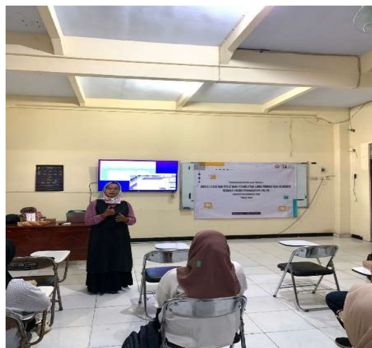
Gambar 5. Tim Pengabdian Menyampaikan Materi

Setelah pemberian materi, tahap selanjutnya adalah sesi diskusi. Dalam tahap ini peserta menyampaikan beberapa permasalahan yang dialami saat ini, dan kemudian dilanjutkan dengan diskusi dengan pemateri untuk tindak lanjut dan upaya mengatasi masalah tersebut. peserta mengemukakan permasalahannya yaitu terjadinya penurunan pendapatan karena ada pesaing pendatang baru, terbatasnya media promosi sehingga hanya masyarakat sekitar yang mengetahui adanya usaha mereka, dan mereka belum bisa menggunakan media digital seperti blog sebagai media pemasarannya. Maka dari itu perlu adanya inovasi dari media pemasaran yang harus dilakukan, agar produk bisa dikenal oleh masyarakat yang tidak hanya tetangga local tetapi juga luar daerah maupun internasional. Setelah acara sesi diskusi berakhir dilanjutkan dengan pembagian doorprize kepada peseta seminar yang ikut berpartisipasi bertanya dan menjawab pertanyaan dengan pemateri.