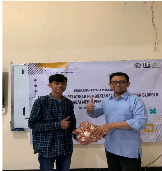
Gambar 6. Pembagian Doorprize