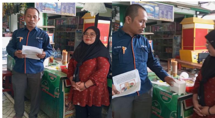
Gambar 4. Sosialisasi 5R Partisipasi dan Aplikatif oleh Tim Teknik Industri

Berdasarkan permasalahan yang teridentifikasi, dilakukan kegiatan sosialisasi metode 5R dengan pendekatan partisipatif dan aplikatif. Sosialisasi dilaksanakan melalui diskusi langsung, penjelasan visual, serta praktik sederhana di area kerja agar mudah dipahami oleh mitra. Materi yang disampaikan meliputi konsep Ringkas, Rapi, Resik, Rawat, dan Rajin, serta kaitannya dengan kebersihan area produksi dan pengelolaan sampah plastik konsumen. Hasil sosialisasi menunjukkan adanya peningkatan pemahaman dan kesadaran mitra terhadap pentingnya penataan area kerja dan pemilahan sampah plastik. Pendekatan partisipatif mendorong mitra untuk terlibat aktif dalam proses perbaikan, sehingga solusi yang dirancang tidak bersifat instruktif semata, tetapi dapat diterapkan sesuai kondisi operasional UMKM (Asrofi & Prabowo, 2020).