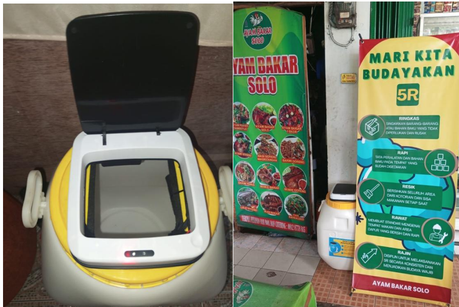
Gambar 5. Sampah Otomatis dan Pemajangan Informasi Prinsip 5R

Tahap uji coba dilakukan untuk menilai efektivitas penerapan TTG dan praktik 5R dalam kegiatan operasional sehari-hari. Uji coba menunjukkan bahwa penggunaan tempat sampah otomatis dan media informasi 5R mampu meningkatkan kedisiplinan pekerja dalam menjaga kebersihan dan melakukan pemilahan sampah plastik. Tanggapan mitra secara umum bersifat positif, terutama karena solusi yang diterapkan mudah digunakan, tidak mengganggu alur kerja, dan memberikan dampak langsung terhadap kerapihan area produksi.