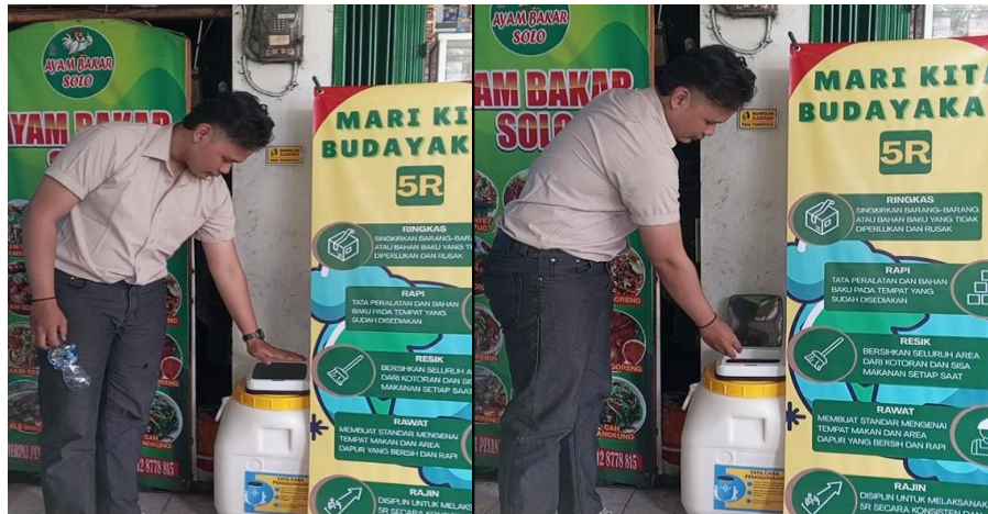
Gambar 6. Uji Coba dan Pemajangan Infromasi

Hasil evaluasi awal menunjukkan adanya perbaikan kondisi visual area kerja, peningkatan kenyamanan kerja, serta potensi keberlanjutan penerapan 5R dan TTG dalam jangka panjang (Asrofi, 2020). Dengan demikian, kegiatan PKM ini menunjukkan bahwa pendekatan Teknik Industri melalui hilirisasi TTG berbasis 5R efektif dalam meningkatkan tata kelola sampah plastik konsumen pada UMKM Ayam Bakar Solo wilayah Depok.