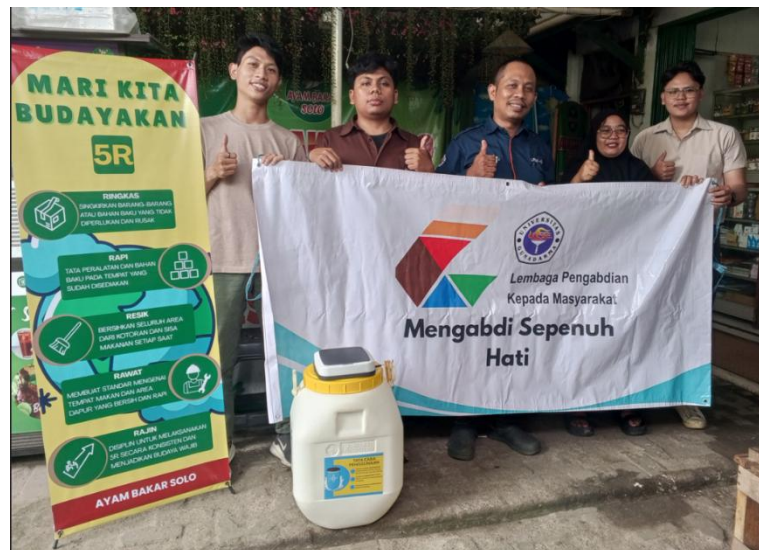
Gambar 7. Tim Mahasiswa Teknik Industri Universitas Gunadarma

Hasil evaluasi awal menunjukkan adanya perbaikan kondisi visual area kerja, peningkatan kenyamanan kerja, serta potensi keberlanjutan penerapan 5R dan TTG dalam jangka panjang (Asrofi, 2020). Dengan demikian, kegiatan PKM ini menunjukkan bahwa pendekatan Teknik Industri melalui hilirisasi TTG berbasis 5R efektif dalam meningkatkan tata kelola sampah plastik konsumen pada UMKM Ayam Bakar Solo wilayah Depok.