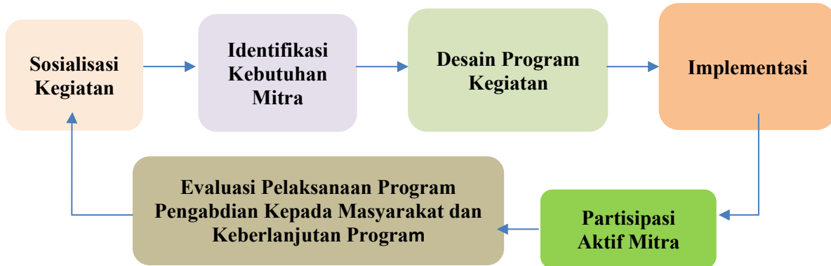
Gambar 1. Metode Pelaksanaan Solusi

kondisi eksisting area produksi, alur kerja, penggunaan plastik sekali pakai, serta sistem pengelolaan sampah plastik. Hasil identifikasi kebutuhan mitra menjadi dasar dalam merumuskan permasalahan utama dan peluang perbaikan yang dapat dilakukan melalui penerapan Teknologi Tepat Guna (TTG) berbasis metode 5R.