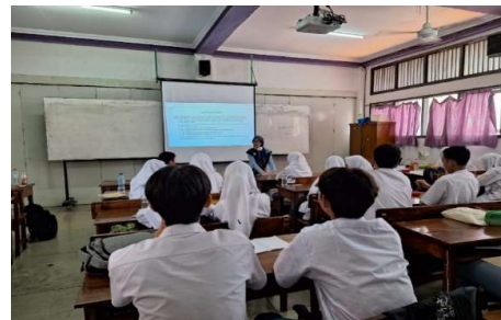
Gambar 8. Peserta Pelatihan