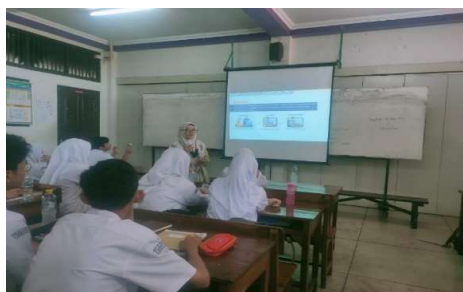
Gambar 7. Peserta Pelatihan