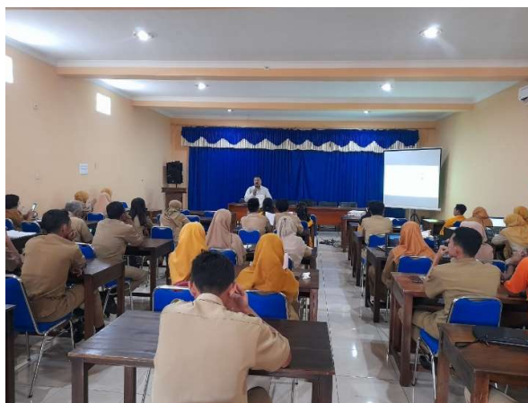
Gambar 2. Foto Pelaksanaan pelatihan

pengetahuan dan keterampilan dalam penulisan Modul Ajar dan memberikan motivasi kepada Bapak/Ibu Guru. Kegiatan pelatihan diawali dengan penyamaan persepsi pentingnya guru dalam meningkatkan profesionalisme melalui penulisan Modul Ajar. Hasil penyamaan persepsi ini menghasilkan gambaran tujuan kegiatan dan hasil dari pengabdian. Selain itu, meningkatkan motivasi dan semangat Bapak/Ibu Guru dalam peningkatan ketrampilan penulisan Modul Ajar. Selanjutnya materi pelatihan berupa kiat-kiat menulis Modul Ajar pada kurikulum merdeka dan dilanjutkan dengan teknis penyusunan Modul Ajar.