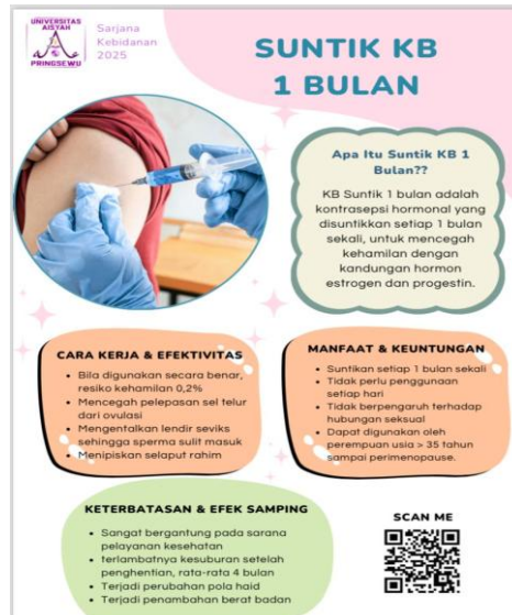
Gambar 3. E-Flyer

Pada tahap kedua, tim mulai menyusun E-flyer dan kuesioner. Flyer dirancang berdasarkan materi yang sebelumnya telah disiapkan, yaitu mengenai kontrasepsi suntik satu bulan. Isi flyer mencakup hal-hal penting seperti definisi, cara kerja, manfaat, efek samping, serta kelebihan dan kekurangannya. Desainnya dibuat sederhana namun tetap menarik dan mudah dipahami, terutama oleh ibu-ibu usia subur sebagai sasaran utamanya.