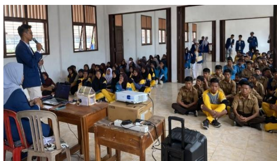
Gambar 1. Sosialisasi IoT

Kegiatan sosialisasi Internet of Things (IoT) melalui demonstrasi Smart Watering System dilaksanakan dengan melibatkan sekitar 40 siswa SMP Harapan Desa Rulung Sari. Kegiatan berlangsung secara tatap muka dalam bentuk pemaparan materi, demonstrasi alat, serta diskusi interaktif. Secara umum, kegiatan berlangsung dengan lancar dan memperoleh respon positif dari peserta. Pada tahap awal kegiatan, siswa diberikan pemahaman mengenai konsep dasar IoT, termasuk pengenalan sensor sebagai alat pengumpul data, mikrokontroler sebagai pengolah data, serta aktuator sebagai pelaksana perintah otomatis. Penyampaian materi dilakukan secara komunikatif dengan mengaitkan contoh penerapan IoT dalam kehidupan sehari-hari, seperti sistem penyiraman otomatis dan perangkat rumah pintar. Pendekatan kontekstual ini bertujuan untuk memudahkan siswa memahami konsep yang sebelumnya mungkin masih bersifat abstrak.