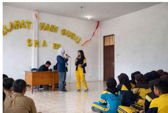
Gambar 3. Tanya Jawab dengan Peserta

Berdasarkan hasil observasi selama kegiatan berlangsung, sebagian besar siswa mampu menjelaskan kembali prinsip dasar sistem yang telah dipaparkan, seperti hubungan antara sensor, pemrosesan data, dan aksi otomatis yang dihasilkan. Hal ini menunjukkan bahwa penggunaan media prototipe sebagai alat bantu pembelajaran memberikan pengalaman belajar yang lebih konkret dibandingkan penyampaian materi secara teoritis semata. Pendekatan learning by doing memungkinkan siswa melihat langsung hubungan sebab-akibat dalam sistem teknologi.