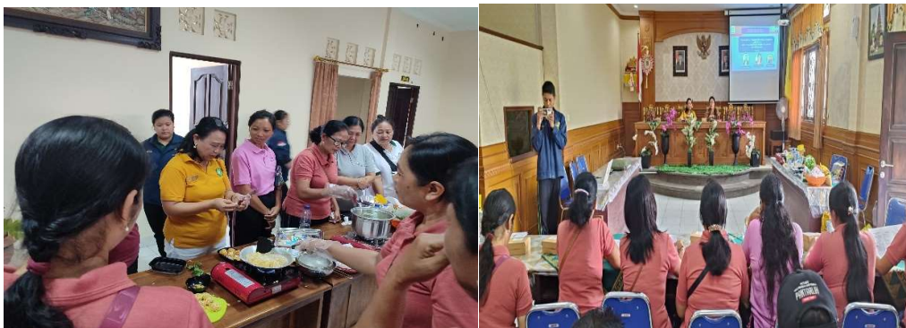
Gambar 3. Foto Pelaksanaan PKM

Setelah dilakukan edukasi dan juga cooking class dilakukan post test dengan hasil yang lebih baik dengan peningkatan nilai pada beberapa peserta yang semula nilai 60 menjadi nilai 80 sehingga dari hasil test diperoleh pengetahuan mereka tentang stunting menjadi lebih baik.