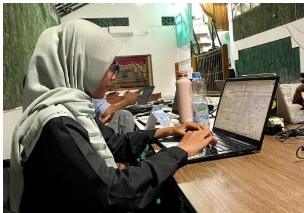
Gambar 11. Pembuatan management letter

Dalam teori audit, dokumentasi temuan audit merupakan bagian penting dalam proses evaluasi hasil pemeriksaan. Temuan audit digunakan sebagai dasar bagi auditor dalam memberikan rekomendasi perbaikan kepada entitas serta dalam menyusun opini audit terhadap laporan keuangan yang diperiksa (Nurfaidah dan Novita 2022).