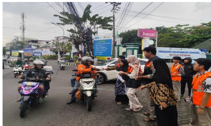
Gambar 3. Tebar takjil di depan UNIMUS

Ramadhan merupakan bulan mulia bagi seluruh umat muslim di dunia. Di Indonesia sendiri pada bulan Ramadhan terdapat beberapa khas yang terjadi, salah satunya yaitu fenomena tebar takjil (Erlina et al. 2024). Lazismu Jawa Tengah selalu mengadakan program tersebut sebagai bentuk sedekah dan kepedulian sosial terhadap masyarakat yang mungkin kesulitan mendapatkan makanan yang layak untuk berbuka. Pada program ini, lazismu tidak lupa melibatkan mahasiswa magang untuk ikut serta dalam melakukan kegiatan yang penuh keberkahan di bulan suci Ramadhan. Dengan tujuan untuk memberikan pemahaman kepada mahasiswa magang mengenai rasa empati dan kepekaan sosial kepada masyarakat, serta menunjukan bentuk nyata dari rasa syukur atas nikmat yang telah Allah berikan dengan menyisihkan sebagian rezeki untuk menyediakan makanan takjil.