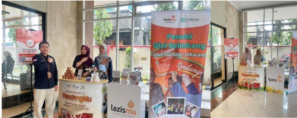
Gambar 2. Menjaga stand Ramadhan

mahasiswa magang juga memberikan pengarahan kepada masyarakat yang ingin mengalurkan ZIS, serta membantu perhitungan zakat yang bagi masyarakat yang ingin melakukan zakat mal maupun zakat fitrah.