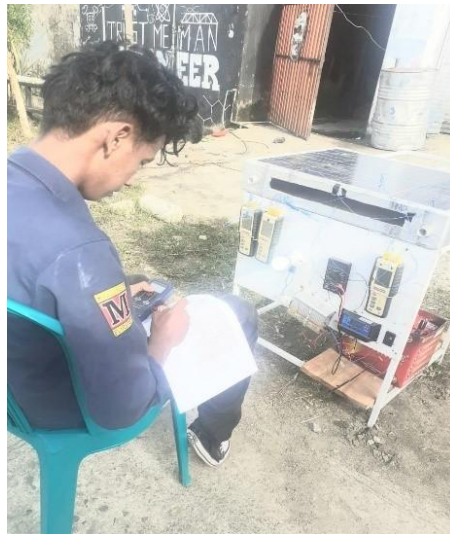
Gambar 5. Proses pengukuran lapangan

Setelah dilakukan prose pembekalan atau pemberian materi maka dilakukan proses praktek langsung lapangan dan cara merakit system PLST sederhana seperti ditunjukkan pada gambar berikut: