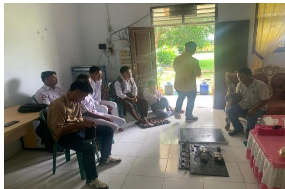
Gambar 3. Proses pengenalan alat