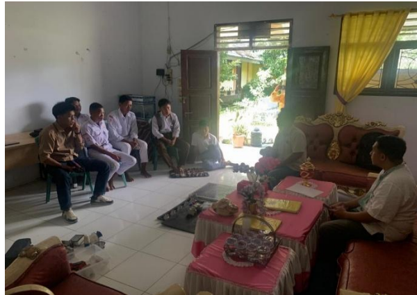
Gambar 2. Pengarahan dari pihak sekolah

Pemberian materi dilakukan untuk meningkatkan pengetahuan dasar siswa sebelum melakukan praktek lapangan, dalam hal ini materi terkait cara atau metode konversi energy dari energy matahari menjadi energi listrik melalui konsep konversi energi PLTS. Dapat dilihat pada gambar berikut: