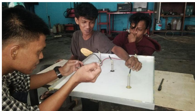
Gambar 6. Proses perakitan panel PLTS

Hasil pelaksanaan menunjukkan bahwa kegiatan ini berhasil mencapai tujuan yang telah ditetapkan. Hal ini ditunjukkan melalui peningkatan pemahaman peserta yang diukur menggunakan pre-test dan post-test. Secara umum, terjadi peningkatan nilai rata – rata siswa sebesar 60.2% siswa mampu menjelaskan proses konversi energi matahari menjadi listrik DC dan konversi listrik DC menjadi listrik AC.