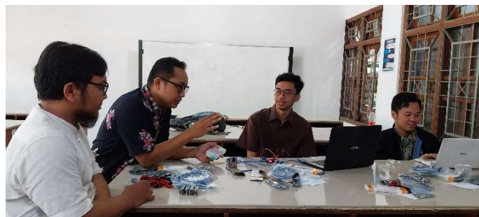
Gambar 2. Persiapan dan ujicoba alat praktikum