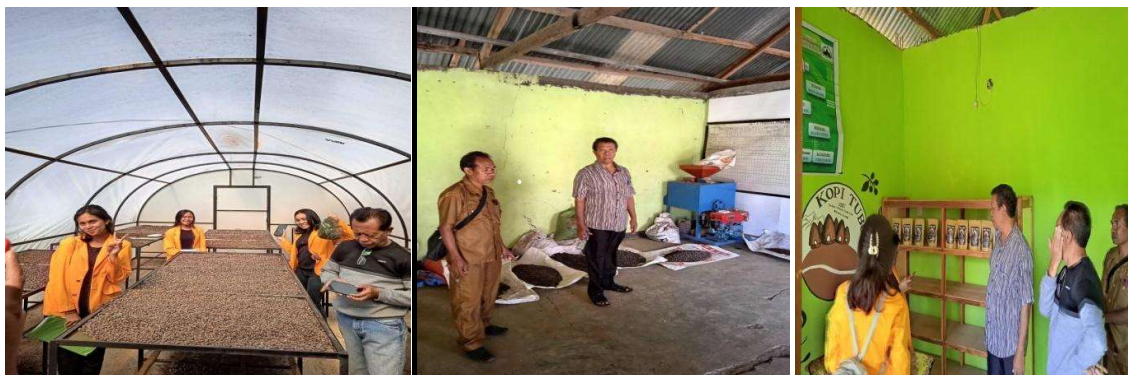
Gambar 3. Pengamatan terhadap usaha Kopi Tubu milik BUMDes Pala Opat

Disamping pemberian materi oleh tim PKM (dosen) kepada kelompok mitra yaitu pemerintah desa, pengelola BUMDes Pala Opat dan masyarakat, tim PKM (dosen) juga melakukan kunjungan dan pengamatan terhadap salah satu jenis usaha yang sudah dikelola BUMDes Pala Opat yaitu usaha produksi Kopi Tubu. Proses produksi Kopi Tubu dimulai dari tahap pembelian kopi dari para petani kopi yang ada di Desa Tubu, kemudian biji kopi tersebut dipilih untuk dikeringkan pada rumah pengeringan dan setelah mendapatkan tingkat kekeringan yang baik, proses selanjutnya disangrai dan digiling dengan menggunakan mesin khusus yang dimiliki oleh BUMDes setelah biji kopi digiling hingga menjadi bubuk kopi tahap yang paling terakhir adalah dengan mengemas kopi pada kemasan khusus yang telah dilabeli.