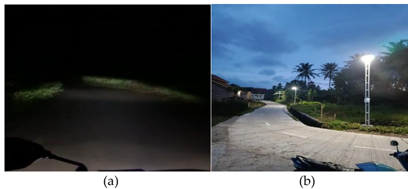
Gambar 2. (a) Kondisi sebelum Pemasangan PJU, (b) Kondisi setelah pemasangan PJU

Solusi pertama adalah pemasangan lampu Penerangan Jalan Umum (PJU) pada titik-titik yang memiliki tingkat pencahayaan rendah. Lampu yang digunakan adalah LED dengan daya sekitar 40 watt yang memiliki efisiensi energi tinggi, umur pakai lebih lama, serta mampu menghasilkan pencahayaan yang optimal. Pemasangan ini diharapkan dapat meningkatkan visibilitas jalan sepanjang \pm 100 meter dan menciptakan lingkungan yang lebih aman bagi masyarakat. Gambar berikut menunjukkan kondisi lokasi sebelum dan sesudah pemasangan PJU.