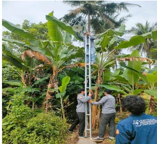
Gambar 4. Tiang PJU dengan pijakan tangga permanen

Solusi ketiga adalah penerapan desain tiang PJU multifungsi yang dilengkapi pijakan besi sebagai tangga permanen. Desain ini memudahkan proses instalasi dan pemeliharaan tanpa memerlukan alat tambahan seperti tangga, sehingga perawatan dapat dilakukan lebih cepat, aman, dan efisien oleh teknisi maupun masyarakat seperti ditunjukkan pada gambar berikut.