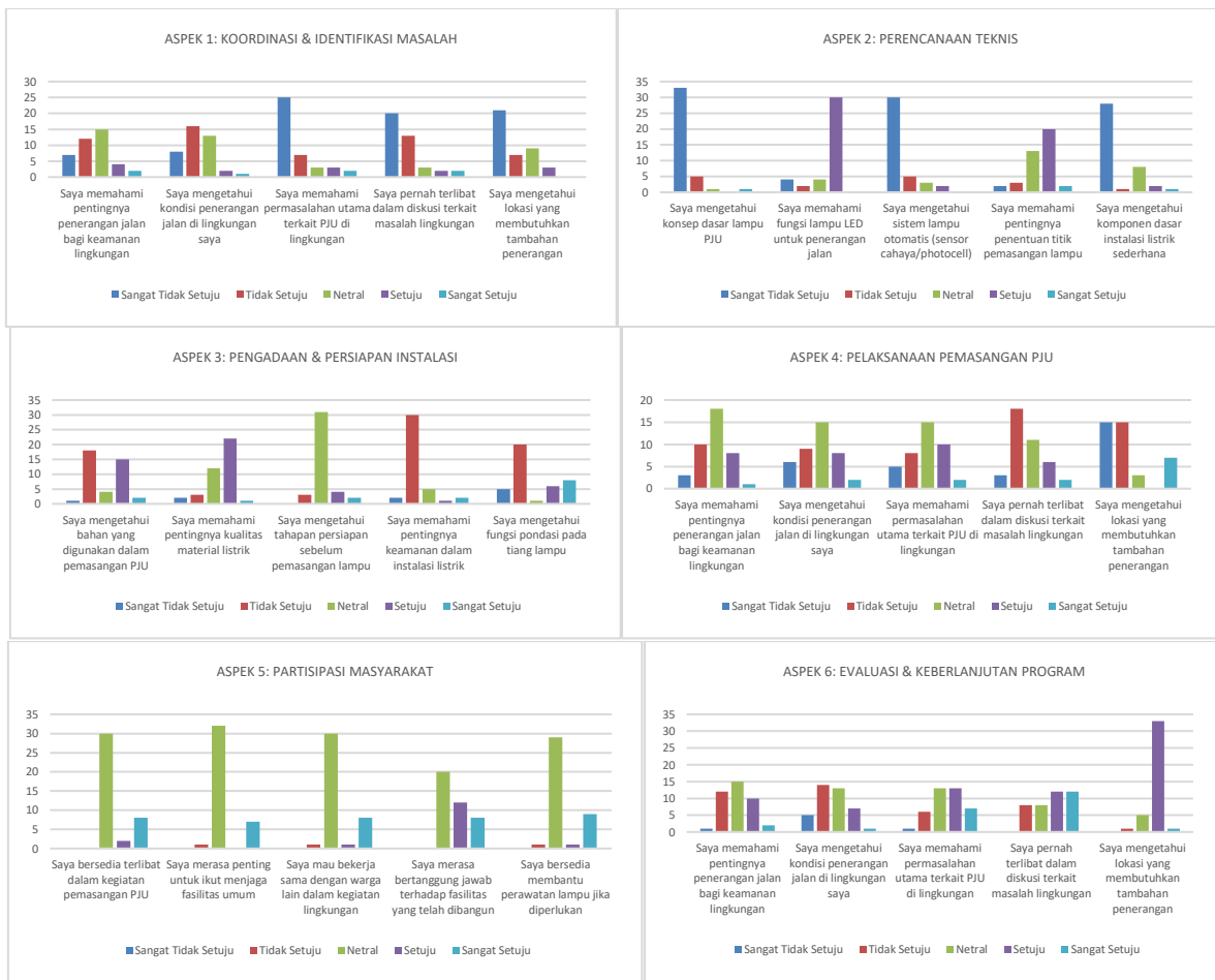
Gambar 6. Pretest

dilaksanakan efektif dalam meningkatkan kapasitas pengetahuan dan keterlibatan masyarakat. Peningkatan terjadi secara konsisten pada seluruh aspek yang diukur. Aspek koordinasi dan identifikasi masalah meningkat sekitar ±44%, menunjukkan bahwa keterlibatan langsung masyarakat dalam observasi mampu meningkatkan pemahaman kontekstual terhadap kebutuhan lingkungan. Aspek perencanaan teknis mengalami peningkatan tertinggi sebesar ±52%, yang menegaskan efektivitas pendekatan praktik dalam menyampaikan materi teknis seperti penggunaan lampu LED, sistem photocell , dan instalasi listrik dasar. Sementara itu, aspek partisipasi dan keberlanjutan meningkat sebesar ±46%, yang mencerminkan adanya perubahan sikap, kesadaran, dan keterlibatan aktif masyarakat dalam menjaga fasilitas yang telah dibangun. Adapun detail perhitungan pretest dan posttest ditunjukkan pada gambar berikut.