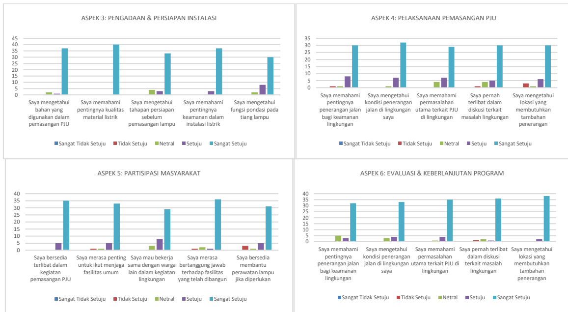
Gambar 7. Posttest

Secara keseluruhan, peningkatan lebih dari 1 poin pada skala Likert menunjukkan keberhasilan signifikan dalam transfer pengetahuan. Pendekatan yang digunakan, yaitu kombinasi project-based learning , demonstrasi langsung, dan partisipasi aktif, terbukti efektif dalam meningkatkan pemahaman teknis sekaligus membangun kesadaran kolektif masyarakat. Hasil ini menunjukkan bahwa program tidak hanya berdampak pada aspek kognitif, tetapi juga pada aspek partisipatif yang mendukung keberlanjutan program di masa mendatang.