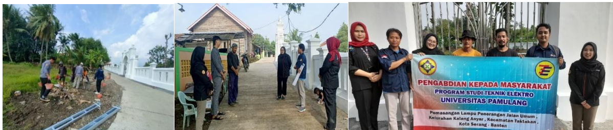
Gambar 5. Keterlibatan masyarakat dalam pemasangan PJU serta edukasi oleh Tim

Solusi terakhir adalah peningkatan partisipasi masyarakat dalam pemeliharaan PJU melalui keterlibatan langsung dalam proses pemasangan serta edukasi mengenai perawatan sederhana. Hal ini bertujuan untuk meningkatkan rasa memiliki masyarakat terhadap fasilitas yang telah dibangun sehingga keberlanjutan fungsi PJU dapat terjaga seperti ditunjukkan dalam gambar berikut.