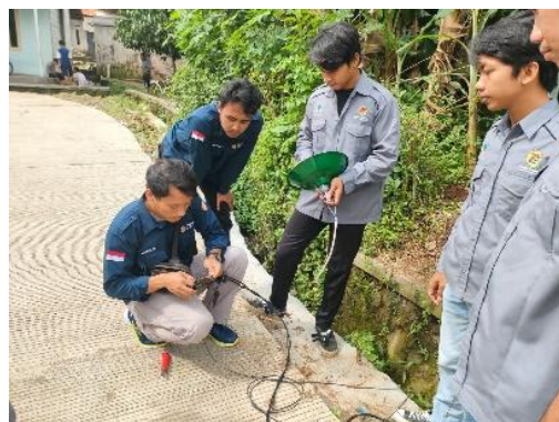
Gambar 3. Instalasi sensor cahaya ( photocell )

Solusi kedua adalah penerapan sistem lampu otomatis berbasis sensor cahaya ( photocell ), yang memungkinkan lampu menyala saat kondisi gelap dan mati saat kondisi terang. Sistem ini meningkatkan efisiensi energi karena lampu hanya beroperasi sesuai kebutuhan, serta mengurangi ketergantungan pada pengoperasian manual. Adapun proses instalasinya ditunjukkan pada gambar berikut.