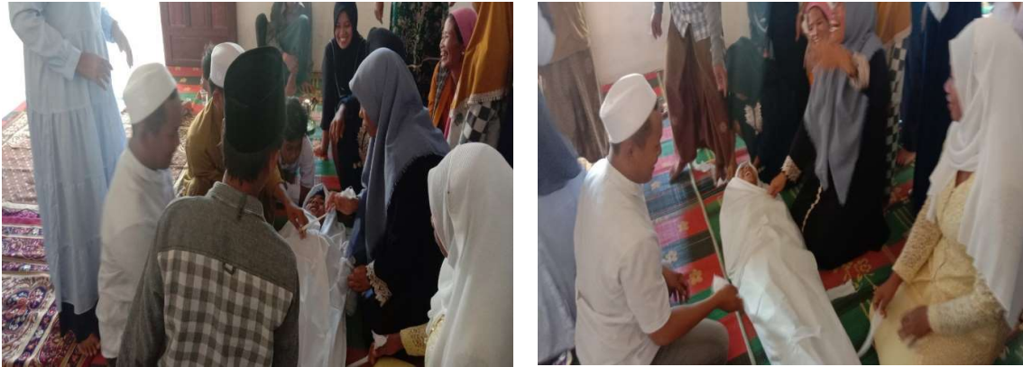
Gambar 4. Praktek mengkafani jenazah

yang digunakan bersama metode tertentu dan pelbagai media pembelajaran. Pertama ketua pelaksana membentuk kelompok satu kelompok beranggotakan minimal 10 orang dan maksimal 20 orang, semua anggota kelompok bersepakat menunjuk 1 orang untuk menjadi pimpinan kelompok.