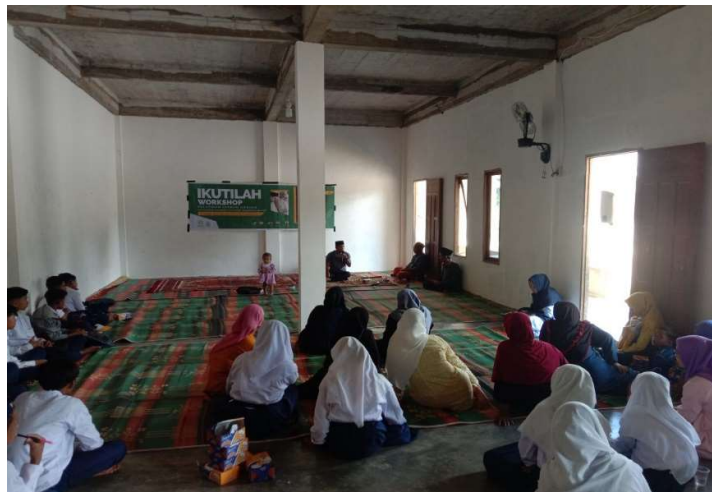
Gambar 2. Kegiatan sosialisasi kepada masyarakat

Workshop yang dilaksanakan di Yayasan Nurul Yaqin Babul Ulum pada tanggal 29-30 Agustus yang beralamat di Desa Kuala Mandor B, Kecamatan Kuala Mandor B. Workshop Fardu kifayah memaparkan penting dan urgennya memandikan, mengkafani, menshalati, memandikan janazah. Melibatkan seluruh komponen tenaga pengajar di MI, MTs, MA, SMPI, PAUD, Ustad/Ustadzah yang Bernaung dibawah naungan Yayasan Nurul Yaqin Babul Ulum dan juga melibatkan sebagian Masyarakat sekitar memandikan, mengkafani, mensholati, dan menguburkan jenazah ini sangat dibutuhkan dan menjadi sesuatu yang wajib diketahui baik di dalam Yayasan mau di masyarkat sekitar. Ketika ada yang meninggal masyarakat saling tunggu menunggu dikarenakan yang mampu hanya segelintir orang saja, oleh sebab itu penting kami mengadakan Workshop atau pelatihan mengenai Fardu Kifayah dari memandikan, mengkafani, mensholati, dan menguburkan Janazah.