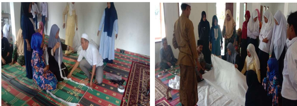
Gambar 3. Praktek menyiapkan kain kafan untuk jenazah

Workshop yang dilaksanakan di Yayasan Nurul Yaqin Babul Ulum pada tanggal 29-30 Agustus yang beralamat di Desa Kuala Mandor B, Kecamatan Kuala Mandor B. Workshop Fardu kifayah memaparkan penting dan urgennya memandikan, mengkafani, menshalati, memandikan janazah. Melibatkan seluruh komponen tenaga pengajar di MI, MTs, MA, SMPI, PAUD, Ustad/Ustadzah yang Bernaung dibawah naungan Yayasan Nurul Yaqin Babul Ulum dan juga melibatkan sebagian Masyarakat sekitar memandikan, mengkafani, mensholati, dan menguburkan jenazah ini sangat dibutuhkan dan menjadi sesuatu yang wajib diketahui baik di dalam Yayasan mau di masyarkat sekitar. Ketika ada yang meninggal masyarakat saling tunggu menunggu dikarenakan yang mampu hanya segelintir orang saja, oleh sebab itu penting kami mengadakan Workshop atau pelatihan mengenai Fardu Kifayah dari memandikan, mengkafani, mensholati, dan menguburkan Janazah.