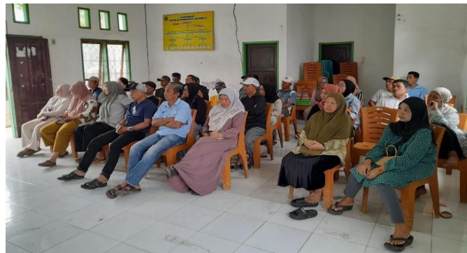
Gambar 4. Para peserta penyuluhan hukum