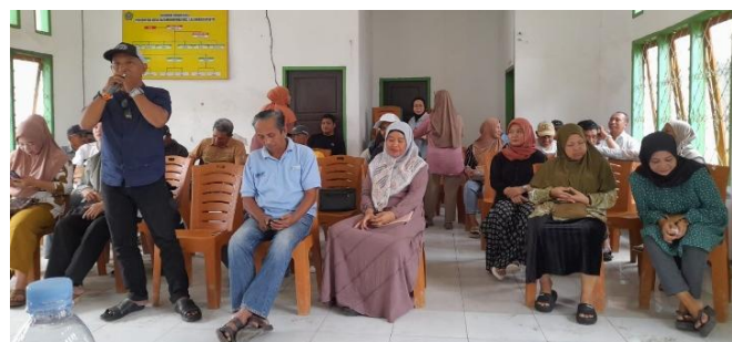
Gambar 5. Sesi tanya jawab seputar moderasi beragama