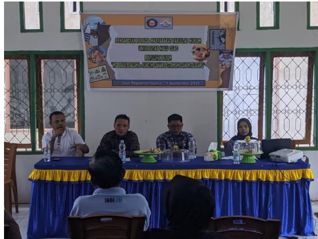
Gambar 3. Penyampaian materi oleh narasumber

Perubahan ini mencerminkan efektivitas metode penyuluhan hukum yang digunakan, yakni ceramah interaktif yang dilanjutkan dengan sesi tanya jawab. Peningkatan pemahaman yang signifikan ini diharapkan dapat memperkuat daya tangkal masyarakat terhadap penyebaran paham ekstremisme dan intoleransi, terutama melalui media digital yang semakin sulit dikontrol. Dengan demikian, kegiatan penyuluhan hukum ini terbukti menjadi instrumen yang efektif dalam meningkatkan kesadaran hukum dan moderasi beragama di tingkat masyarakat desa, khususnya di Desa Rapambinopaka, Kecamatan Lalonggasumeeto, Kabupaten Konawe, Sulawesi Tenggara.