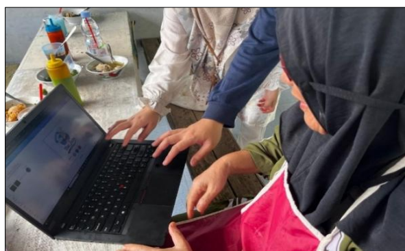
Gambar 5. Pengenalan aplikasi canva pada mitra

Selanjutnya dilakukan pendampingan penerapan strategi digital marketing sebagai tindak lanjut dari kegiatan pelatihan dan produksi konten. Tahap ini bertujuan untuk memperkuat kemandirian mitra dalam mengelola pemasaran digital secara berkelanjutan. Mitra didorong mengelola akun secara mandiri dengan rutin mengunggah konten sesuai jadwal menggunakan template desain dan teknik caption AIDCA. Selain itu, mitra dilatih menggunakan aplikasi desain seperti Canva untuk membuat materi promosi sederhana serta diberikan panduan membangun komunikasi dua arah dengan pelanggan melalui komentar dan Direct Message di Instagram guna meningkatkan kedekatan dengan konsumen dan citra usaha yang lebih profesional.