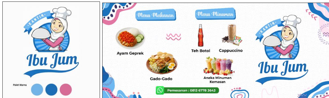
Gambar 2. Desain logo dan Banner “Kantin Ibu Jum”

mitra memahami pentingnya identitas visual dalam membangun citra usaha. Dalam pelatihan ini, mitra diperkenalkan pada konsep dasar pembuatan logo, pemilihan palet warna yang sesuai dengan karakter usaha, penggunaan tipografi, serta pembuatan template konten yang dapat digunakan pada media promosi digital. Melalui kegiatan ini dihasilkan rancangan awal logo “Kantin Ibu Jum” beserta beberapa material visual pendukung yang dapat digunakan sebagai identitas usaha dalam berbagai media promosi.