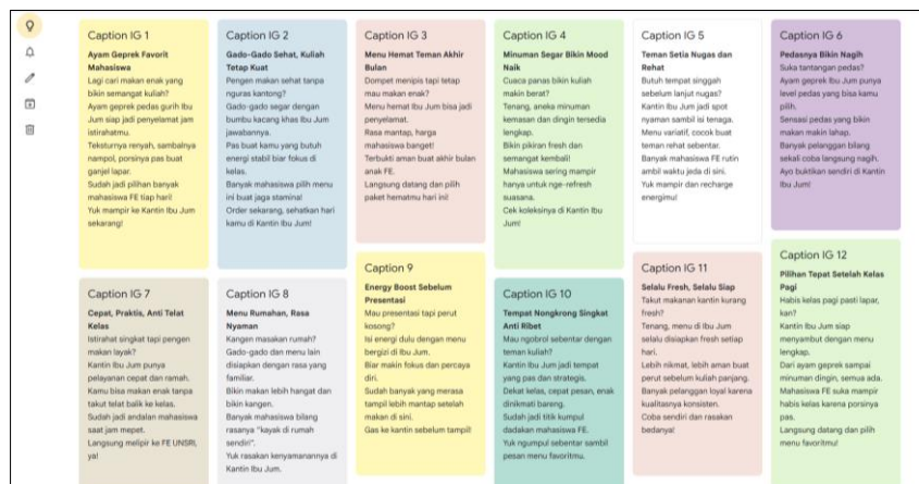
Gambar 3. Kumpulan caption Instagram “Kantin Ibu Jum”

Kegiatan selanjutnya adalah pelatihan copywriting digital yang difokuskan pada teknik penyusunan pesan promosi yang menarik dan persuasif. Dalam pelatihan ini mitra diperkenalkan pada model AIDCA ( Attention, Interest, Desire, Conviction, Action ) sebagai kerangka dalam menyusun caption promosi di media sosial. Mitra kemudian diberikan kesempatan untuk mempraktikkan langsung penulisan caption promosi berdasarkan menu favorit serta promosi harian yang ditawarkan di kantin, dengan menghasilkan sekitar 6 hingga 10 contoh caption yang dapat digunakan sebagai konten promosi di media sosial.