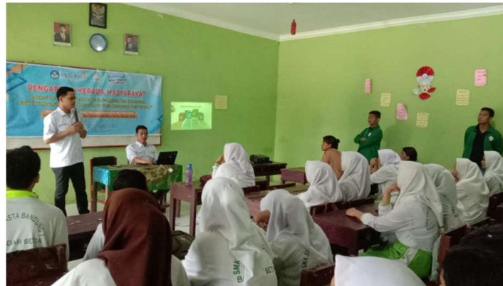
Gambar 2. Pemberian Materi

yang tidak produktif secara ekonomi yakni warga sekolah yang berada di Desa Bandar Setia Kabupaten Deli Serdang. Target utama dalam kegiatan pengabdian ini adalah pihak penyelenggara pada tiap satuan pendidikan yakni guru yang mendapatkan tugas tambahan yakni Kesiswaan . Wakil Kepala Sekolah bidang Kesiswaan adalah suatu penataan atau pengaturan segala aspek aktivitas yang berkaitan dengan peserta didik, yaitu dari mulai masuknya peserta didik (siswa) sampai keluarnya peserta didik (siswa) tersebut. Keberhasilan dalam penyelenggaraan pendidikan akan sangat bergantung dengan perkembangan potensi fisik, kecerdasan intelektual, sosial, emosional dan kejiwaan peserta didik.