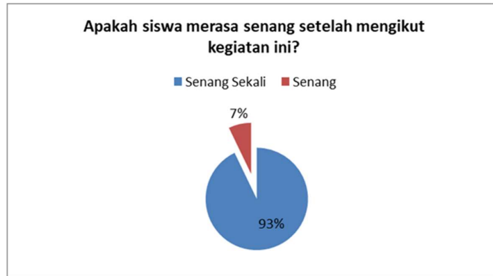
Gambar 8. Kepuasan peserta