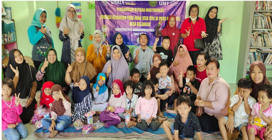
Gambar 1. Foto Kehadiran Peserta