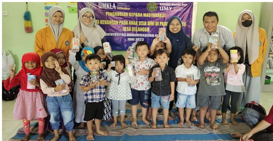
Gambar 2. Peserta menunjukkan alat peraga "Tabungan"