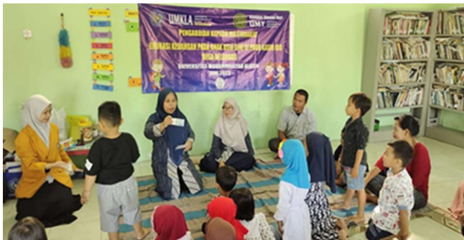
Gambar 3. Pemberian Materi