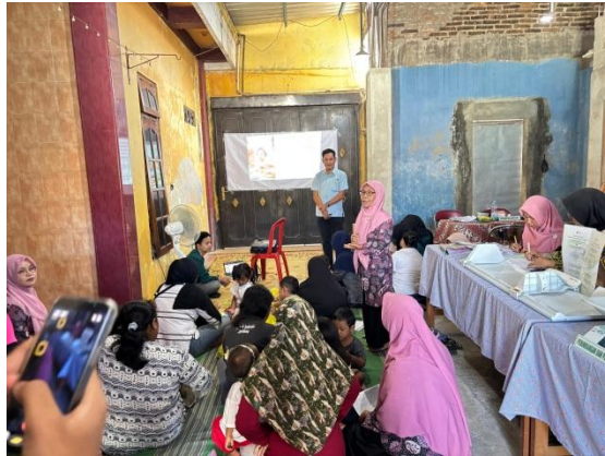
Gambar 3. Melakukan Diskusi dan Pretest

Hasil evaluasi digunakan untuk menilai efektivitas kegiatan edukasi dalam meningkatkan literasi orang tua dan kader Posyandu tentang gangguan makan dan menelan pada anak balita. Tahap tindak lanjut dilakukan melalui pemberian media edukasi kepada peserta dan kader Posyandu agar dapat digunakan kembali dalam kegiatan Posyandu. Kader juga diarahkan untuk melakukan pemantauan sederhana terhadap balita yang memiliki tanda risiko gangguan makan dan menelan. Apabila ditemukan balita dengan tanda risiko, kader dapat mencatat temuan, melaporkan kepada bidan desa atau Puskesmas, serta menganjurkan orang tua untuk melakukan pemeriksaan lebih lanjut ke fasilitas kesehatan atau layanan terapi wicara. Dengan tahapan ini, kegiatan diharapkan dapat berkelanjutan dan mendukung peran Posyandu dalam deteksi dini gangguan makan dan menelan pada balita.