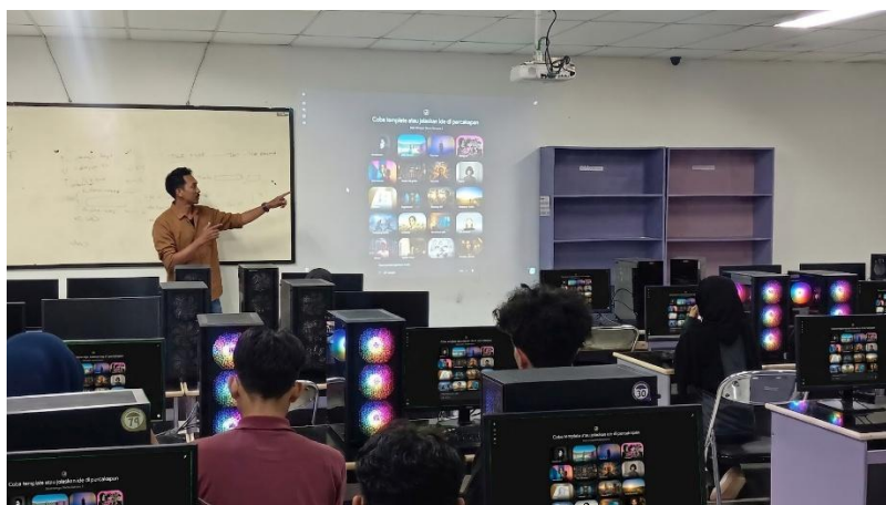
Gambar 1. Sesi Pelatihan

Pada sesi workshop , peserta diperkenalkan pada teknik prompt engineering sebagai dasar utama dalam menghasilkan visual menggunakan AI generative Nanobanana. Pada tahap awal praktik, beberapa mahasiswa masih mengalami kesulitan dalam menyusun prompt yang spesifik sehingga hasil visual yang dihasilkan belum sesuai dengan ide yang diinginkan. Namun setelah dilakukan simulasi dan pendampingan secara langsung, peserta mulai memahami hubungan antara struktur prompt dengan output gambar yang dihasilkan. Mahasiswa juga terlihat aktif mencoba berbagai kombinasi prompt untuk menghasilkan karakter, environment, maupun aset visual game lainnya.