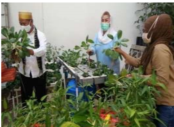
Gambar 7. Perkarangan rumah jadi urban farming

B. Kegiatan-kegiatan dalam Pembuatan Film Pendek mengenai kondisi/keadaan Kelurahan Kalisegoro dalam rangka event Urban Farming Champion dan Bulan Bhakti Gotong Royong yang diadakan Pemda Kotamadya Semarang.