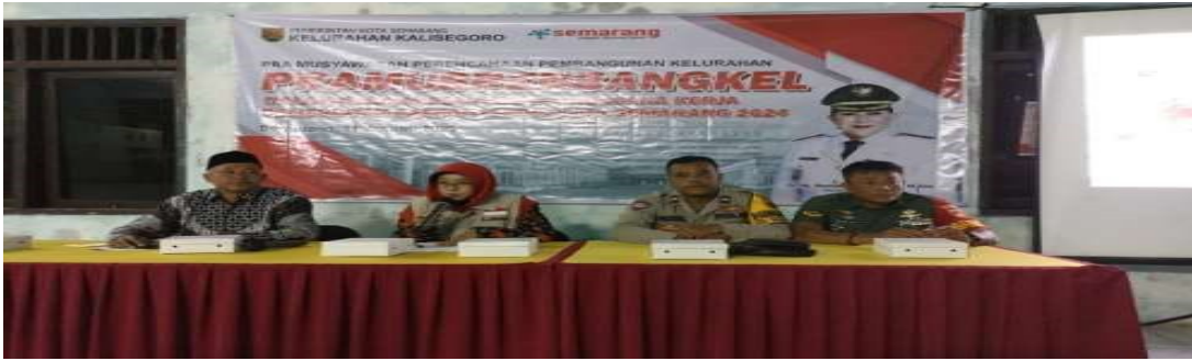
Gambar 6. FGD Pembentukan Pokdarwis

Proses Pembuatan Film dalam rangka Urban Farming Champion dan Bulan Bhakti Gotong Royong Kelurahan Kalisegoro. Pada Kegiatan ini Tim Stiepari beserta TV Stiepari bekerja turun lapangan kesetiap lokasi pengambilan film beserta Tim Kelurahan yang dipimpin langsung oleh Bu Lurah. Pengambilan film dimulai dari Urban farming yang memerlukan 2 hari dalam pelaksanaannya, selama 2 minggu. Kegiatan selanjutnya pembuatan film bertema Bulan Bhakti Gotong Royong yang memakan waktu 3 hari selama durasi 3 minggu.