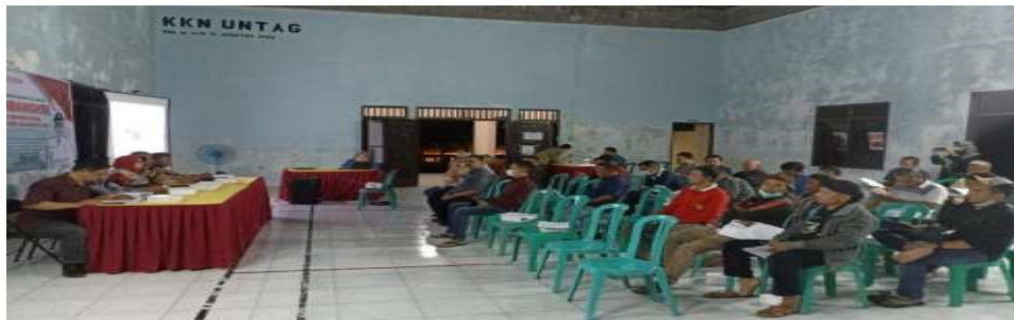
Gambar 4. FGD Kelembagaan Kelurahan