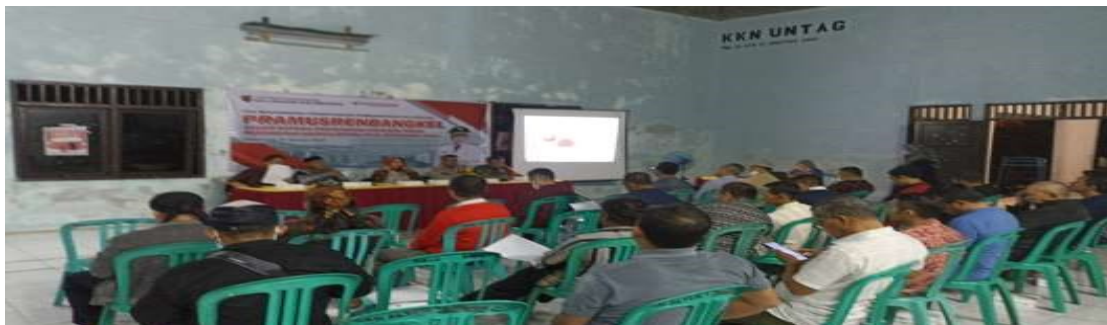
Gambar 2. Pra-Kegiatan Inventarisasi Masalah

Sebelum Tim melakukan kegiatan Pengabdian dilakukan kunjungan Pra kegiatan untuk bersilaturahmi dengan pihak Aparat Kelurahan Kalisegoro. Dalam pertemuan tersebut dihadiri oleh Aparat Pemerintah Kelurahan termasuk Ibu Lurah dan Tim Dosen pelaksana Pengabdian kepada Masyarakat Kelurahan Kalisegoro Dalam pertemuan tersebut Tim meminta menyampaikan permasalahan yang dihadapi oleh Kelurahan, agar dapat memetakan pendampingan. Pihak Kelurahan diminta menyiapkan inventarisasi masalah dalam aspek Kelembagaan, Sumber Daya Manusia, Produk dan Promosi. Hasil Inventarisasi akan dijadikan bahan untuk pendampingan tim.