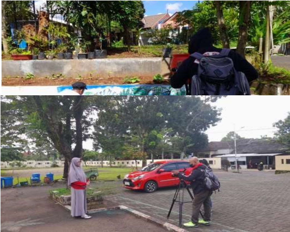
Gambar 9. Pengambilan gambar film

Hasil Pengambilan gambar film diedit dan diolah oleh Tim TV Stiepari menjadi hasil Film Pendek yang dikemas dalam Youtube yang bisa dilihat melalui link dibawah.