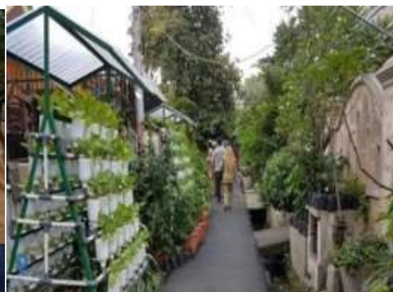
Gambar 8. Urban Farming di halaman tempat ibadah