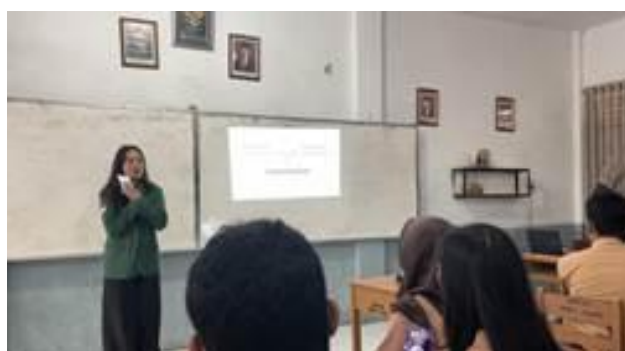
Gambar 3. Sesi Materi 1

Setelah pre-test , peserta kemudian mengikuti sesi energizer yang bertujuan untuk menciptakan suasana yang lebih santai, menyenangkan, dan kondusif. Kegiatan ini juga membantu meningkatkan fokus, semangat, serta kesiapan peserta untuk mengikuti rangkaian pelatihan yang akan berlangsung. Tingginya partisipasi peserta pada sesi energizer menunjukkan bahwa kegiatan ini berhasil meningkatkan kesiapan peserta untuk mengikuti pelatihan. Aktivitas pemanasan seperti energizer diketahui dapat meningkatkan fokus, perhatian, dan keterlibatan peserta dalam proses pembelajaran sehingga mereka lebih siap menerima materi yang akan diberikan (Knowles et al., 2020).