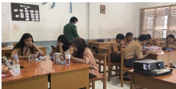
Gambar 1. Sesi Pre Test

Sebelum kegiatan inti dimulai, peserta mengisi pre-test untuk mengukur pemahaman awal mereka mengenai komunikasi interpersonal. Hasil pre-test menunjukkan bahwa rata-rata skor peserta berada pada angka 7,8 dengan rentang nilai antara 4 hingga 10.