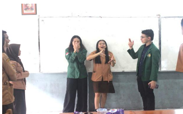
Gambar 4. Sesi Ice Breaking

secara aktif, memberikan respons, bekerja sama, serta menyelesaikan permasalahan komunikasi dalam kelompok. Metode yang digunakan berdasar pada prinsip experiential learning , di mana peserta tidak sekadar menerima informasi secara pasif tetapi juga terlibat aktif melalui simulasi, diskusi, dan permainan kelompok. Pendekatan semacam ini terbukti efektif dalam membantu individu mengembangkan keterampilan komunikasi karena peserta dapat langsung mempraktikkan dan merefleksikan pengalaman mereka dalam situasi yang menyerupai dinamika nyata (Damayanti et al., 2025).