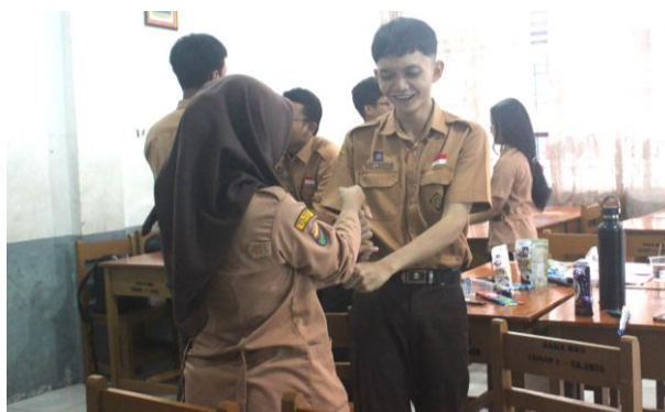
Gambar 2. Sesi Energizer

komunikasi interpersonal menurut DeVito (2016), yaitu keterbukaan, empati, sikap mendukung, sikap positif, dan kesetaraan. Penyampaian materi dilakukan secara interaktif dengan melibatkan peserta dalam tanya jawab, diskusi, dan refleksi singkat. Kelima aspek tersebut dipilih karena relevan dengan tantangan komunikasi yang dihadapi anggota OSIS dalam menjalankan koordinasi dan kerja sama organisasi. Pada tahap ini, fasilitator mengamati bahwa sebagian besar peserta pada awalnya cenderung pasif dan kurang berani menyampaikan pendapat secara terbuka. Beberapa peserta tampak ragu untuk merespons pertanyaan fasilitator dan lebih memilih menunggu rekan lain berbicara terlebih dahulu. Meski demikian, keterlibatan peserta mulai meningkat seiring berjalannya sesi, di mana peserta perlahan mulai berani mengajukan pertanyaan dan memberikan respons dalam diskusi kelompok.