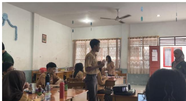
Gambar 7. Sesi Materi Ketiga

Pada sesi penyampaian materi yang ketiga, para peserta melaksanakan analisis atas studi kasus dan berdiskusi dalam kelompok mengenai pertikaian dalam sebuah organisasi. Berdasarkan hasil evaluasi formatif, para peserta menunjukkan kemampuan yang relatif baik dalam mengemukakan argumen, mendengarkan pendapat peserta lainnya, dan mencari penyelesaian untuk masalah yang dihadapkan.