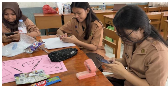
Gambar 10 Evaluasi Pelatihan