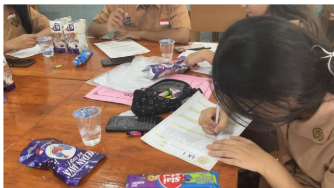
Gambar 5. Sesi Materi Kedua

Selama permainan berlangsung, peserta memperoleh pengalaman langsung mengenai kemungkinan terjadinya perubahan pesan ketika komunikasi tidak dilakukan secara jelas dan akurat. Pengalaman tersebut membantu peserta memahami pentingnya kemampuan menyampaikan dan menerima pesan secara tepat. Tubbs dan Moss (2017) menjelaskan bahwa keberhasilan komunikasi sangat dipengaruhi oleh kemampuan individu dalam meminimalkan distorsi pesan selama proses komunikasi berlangsung.