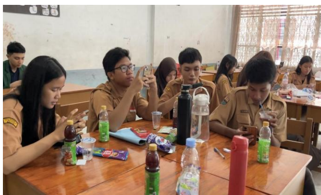
Gambar 8. Sesi Post-test

Beberapa peserta mampu mengembangkan argumen yang rasional, memberikan contoh yang sesuai, dan membantu memandu perjalanan diskusi kelompok. Walaupun ada peserta yang pada awalnya bersikap pasif, mayoritas mulai menunjukkan keterlibatan yang lebih aktif seiring jalannya diskusi. Temuan ini mengindikasikan bahwa peserta dapat menerapkan keterampilan komunikasi antarpribadi dalam konteks resolusi konflik. Menurut Adler et al. (2020), komunikasi interpersonal yang efisien memainkan peranan penting dalam proses penyelesaian perselisihan karena memungkinkan individu memahami sudut pandang orang lain, membangun empati, dan menemukan solusi yang dapat diterima secara bersama.